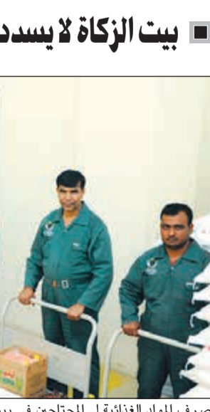
مبنى بيت الزكاة