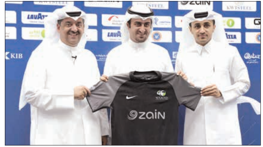
«زين» الراعي الرئيسي لدورة الروضان بدورتها الـ 40