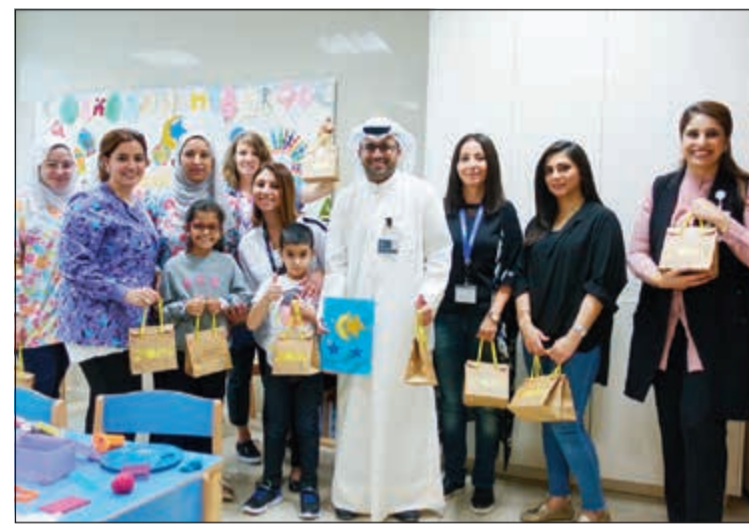
من الزيارات الاجتماعية السابقة