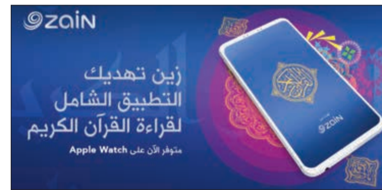
تطبيق القرآن الكريم من زين

وحول الجوانب الرياضية التي تشهد تواجداً سنوياً للشركة خلال الشهر المبارك، ترعى «زين» النسخة الـ 40 من دورة المرحوم عبدالله مشاري الروضان الرمضانية لكرة القدم للسنة الرابعة على التوالي، وهي الدورة التي تأتي تحت رعاية سامية من حضرة صاحب السمو أمير البلاد الشيخ صباح الأحمد،