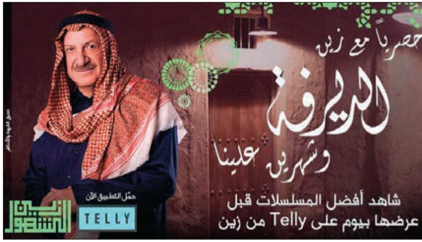
عرض حصري لتطبيق Telly من زين