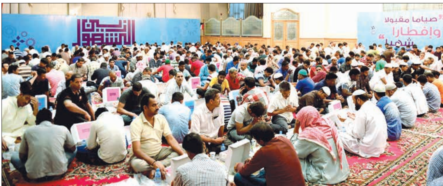
صالات زين لإفطار الصائم

ويوفر التطبيق مجموعة كبيرة من المميزات الرائعة، والتي تشمل تحميل وقراءة جميع صفحات القرآن الكريم في واجهة سهلة الاستخدام،