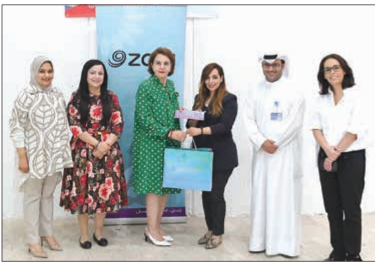
زين تقدم «المجلة الرمضانية» عبر شركائها الاستراتيجيين

وأما عن المسابقات الرمضانية التي دائماً ما يتشوق لها الجمهور في موسم شهر رمضان المبارك، فقد أعلنت «زين» عن رعايتها للبرنامج الإذاعي المنمّن «كنز FM»، يوماً طوال شهر رمضان المبارك، بحيث يستطيع عملاء زين المشاركة في المسابقات العديدة التي يقدمها هذا البرنامج المميز والفوز بجوائز قيمة.