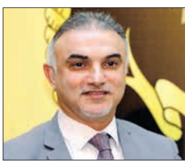
عبدالكريم تقي مدير عام الهيئة العامة للصناعة

وعلى صعيد القطاعات، فقد ارتفعت معدلات الاقتراض لقطاع الإنشاءات الذي شهد زيادة شهرية قدرها 108 ملايين دينار وبنسبة نمو 5,4%، لتسجل مستوى 2,1 مليار دينار بنهاية مارس الماضي، مقارنة