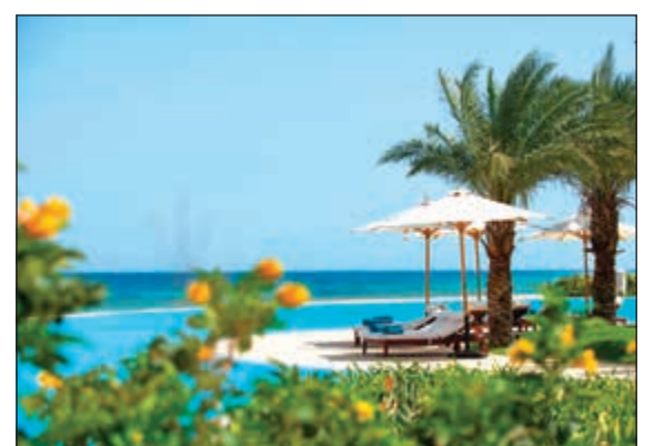
اطلالة مباشرة على البحر الأحمر