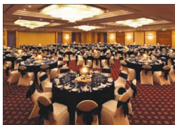
قاعات اجتماعات متنوعة لجميع الفعاليات