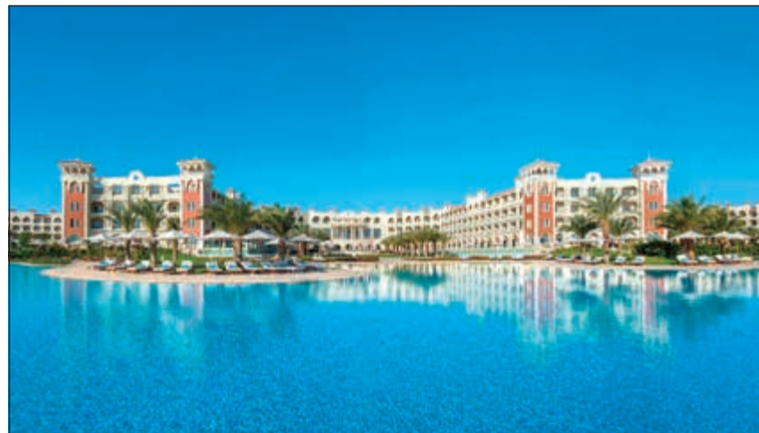
أجواء رائعة للاستمتاع بأجواء سهل حشيش