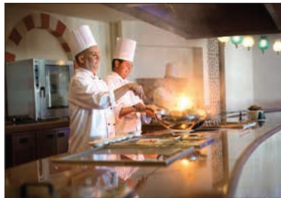
فريق من الطهاة المحترفين يقومون على خدمة الزبائن

كم عدد السياح الآن في مصر؟ ● ليست هناك أرقام محددة ولكن نحن نقترب من أرقام 2010 وهي 14 مليون سائح وهو بالنسبة لمصر عام الذروة والدليل الآن أن كل الفنادق في الغردقة وشرم الشيخ