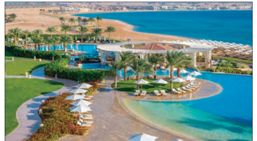
اطلالة رائعة للفندق