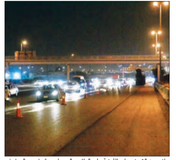
جانب من التحضيرات الأمنية على الدائري السادس قبيل بدء العمل في إصلاح الأجزاء المتضررة من الطريق (قاسم باشا)

أشارت إلى أن هيئة الطرق تواصل تنفيذ برنامجها المعتمد والتنسيق مع الإدارة العامة للمرور