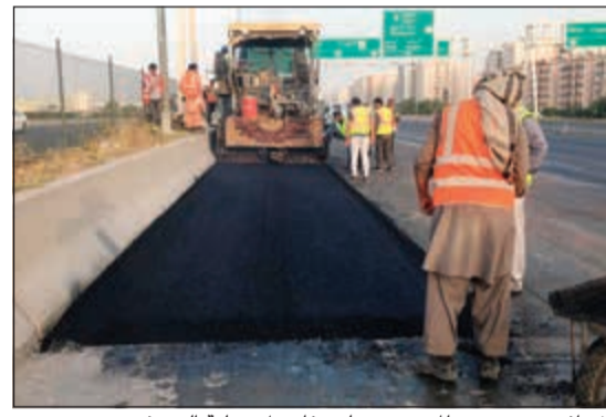
إشراف مستمر من المهندسين على تفاصيل عملية الرصف