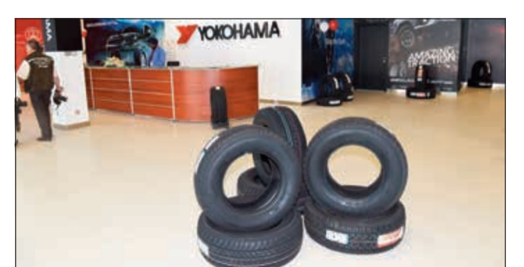
مركز تركيب إطارات يوكوهاما