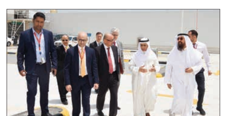
جولة داخل مركز الصيانة الجديد