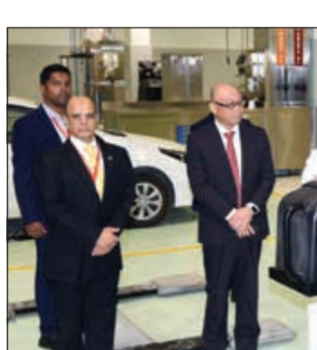
المركز مجهز بأحدث المعدات

نمو وتطور، نعتزم تطوير شبكة معارضنا ومرافق خدماتنا حتى نكون أقرب لعملائنا بأن تكون جزءاً من الحي الذي يعيشون فيه، نود أن يشعر عملائنا عند زيارتنا بأنهم في بيتهم. وتابع «جميعنا في السايير، انطلاقاً من أعضاء مجلس الإدارة وصولاً إلى كل عضو في الفريق، نركز على شيء واحد فقط ألا وهو تقديم تجربة عملاء غير مسبوقة، وكما يقول أصدقائنا من تويوتا اليابان «رسم الابتسامه على وجه كل عميل».