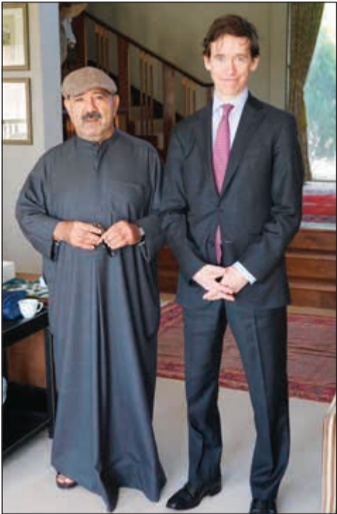
الشيخ ناصر صباح الأحمد خلال لقائه ووزير التنمية الدولية البريطاني روري ستورتون

بحث النائب الأول لرئيس مجلس الوزراء ووزير الدفاع الشيخ ناصر صباح الأحمد مع وزير التنمية الدولية البريطاني روري ستورتون إمكانية تعاون ومشاركة المملكة المتحدة في تنفيذ رؤية السمو الأمير «كويت جديدة 2035».