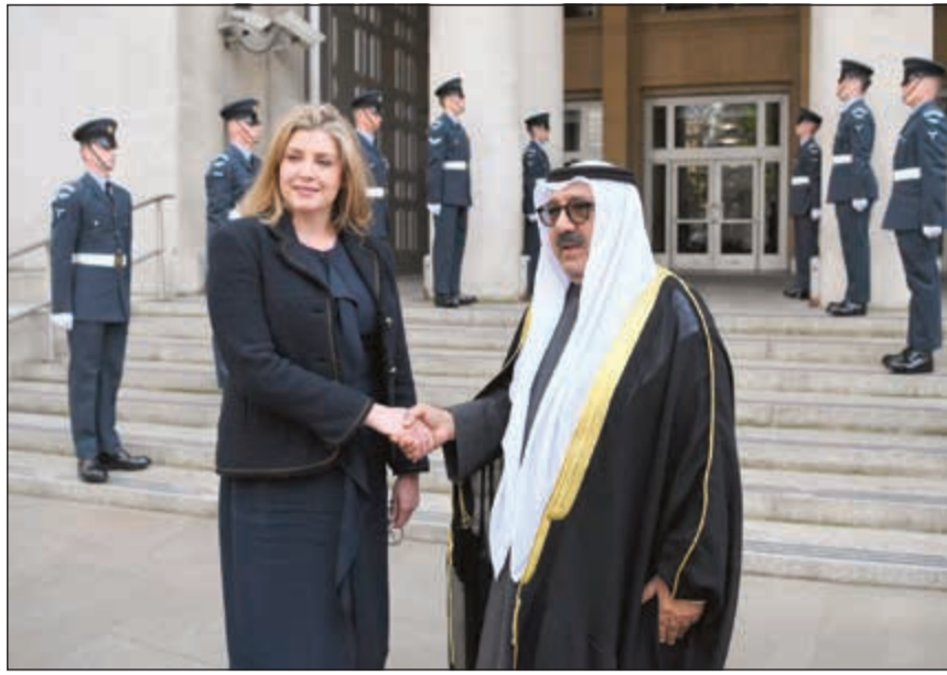
الشيخ ناصر صباح الأحمد مصافحا وزيرة الدفاع البريطانية بيني موردينت