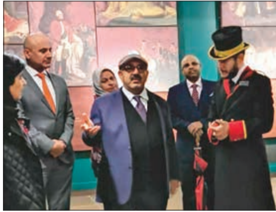
..وخلال جولة في أرجاء المتحف

كما بحث الجانبان بحسب البيان مشروع المنطقة الاقتصادية الشمالية وإمكانية الاستفادة مما تتمتع به بريطانيا من تاريخ طويل وحافل في مجال إدارة المدن الاقتصادية الدولية مثل هونغ كونغ وجبل طارق وسنغافورة.