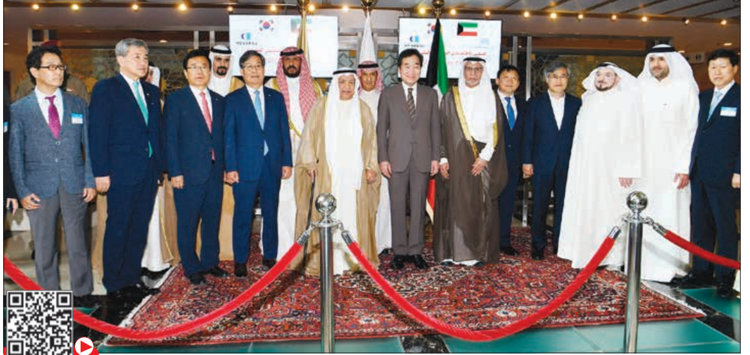
رئيس الوزراء في جمهورية كوريا الجنوبية لي ناكيون والوفد المرافق له في صورة جماعية مع علي الغانم واعضاء غرفة التجارة والصناعة