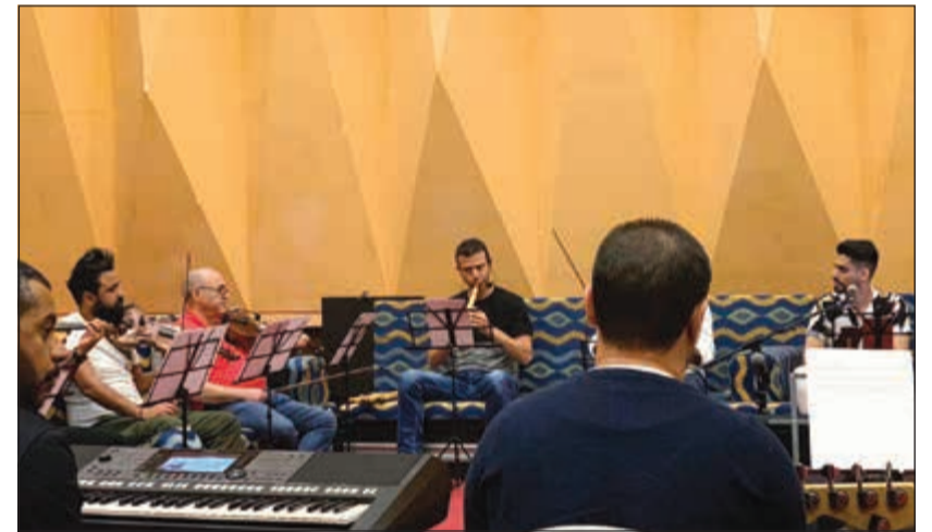
من اجراء برنامج ليالي السعود

تميز ذلك البرنامج بالتجديد، وهذا ما أدى الى استمراريته، لأن لكل نجاح استمراراً لا متناهياً ومتواصلاً، ولأن طاغم البرنامج في عطاء مستمر لدفع ذلك البرنامج الى الأمام دائماً، والأكد أن دعم «دينامو الإذاعة» وكيل قطاع الإذاعة الشيخ فهد المبارك الصباح للبرنامج اضاف له قيمة كبيرة، فالشيخ فهد دائماً يدعم أبناءه من الإعلاميين والقائمين على البرامج التي تثرى أرشيف الإذاعة، فهو ذو نظرة ثاقبة.