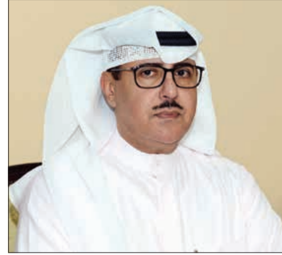
وكيل الإذاعة الشيخ فهد المبارك