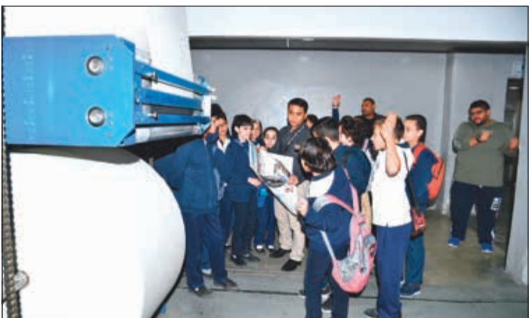
المطبعة المكان الأكثر تشويقاً للطلبة