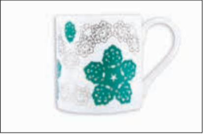
أكواب مصممة من عصر الشاه