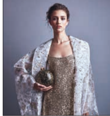
من المجموعة الرمضانية المميزة