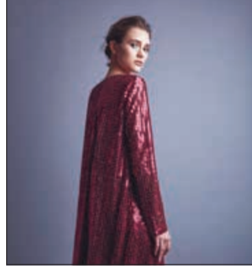
تصاميم وإكسسوارات مميزة

حداثة لم يسبق لها مثيل في المنطقة وفي العصر الجديد، مع 18 طنا من الطعام، دعا الملوك والمشاهير للاحتفال، حيث استضافت الأباطرة والملوك والملكات والرؤساء والشيوخ من جميع أنحاء العالم لمدة 3 أيام وسط أطلال برسيبوليس القديمة، ومن هناك أستوحيت هذه المجموعة الفاخرة.