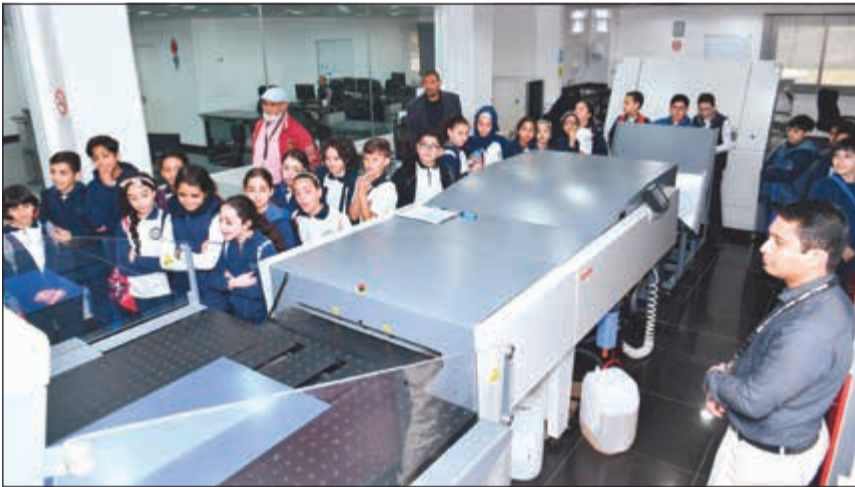
الطلبة يطلعون على طريقة طباعة الجريدة في قسم الإنتاج