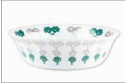
أدوات مائدة من النوع الفاخر