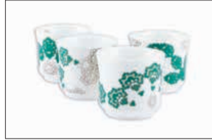
أكواب القهوة من «زمرّد»