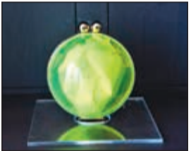
إبداع في التصميم