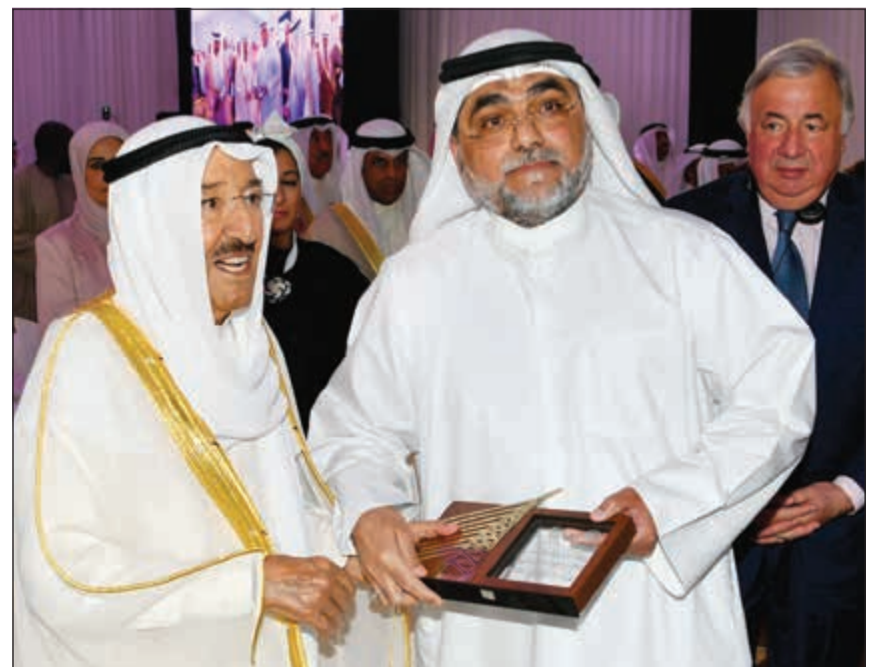
صاحب السمو مكرماً أحد ذوي شهداء الواجب الذين ضحوا بأرواحهم خلال عملهم في الجسر