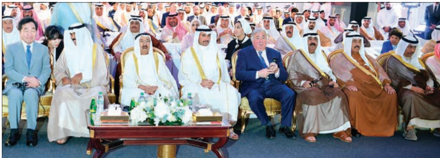
صاحب السمو الأمير الشيخ صباح الأحمد وسمو ولي العهد الشيخ نواف الأحمد ورئيس مجلس الأمة مرزوق الغانم ورئيس وزراء كوريا لي تاكيون ورئيس مجلس الشيوخ الفرنسي جيرار لارشي والشيخ مشعل الأحمد وسمو الشيخ ناصر المحمد وسمو الشيخ جابر المبارك في مقدمة الحضور