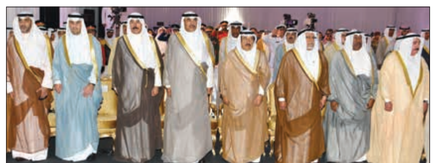
الشيخ سالم صباح الناصر والشيخ علي العبدالله والشيخ علي الجراح والشيخ د. سالم الجابر والشيخ صباح الخالد والشيخ محمد الخالد وأنس الصالح والشيخ محمد العبدالله