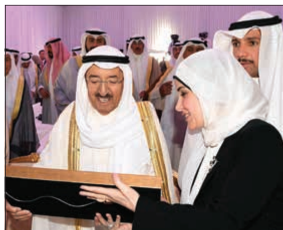
هدية تذكارية لصاحب السمو الأمير الشيخ صباح الأحمد تقدمها لسموه د. جنان بوشهري

وقالت: صاحب السمو، نبدأ اليوم عهداً جديداً في بناء كويت 2035 تحت رؤية سموكم الكريمة وتوجيهاتكم السامية، واضعين نصب أعيننا