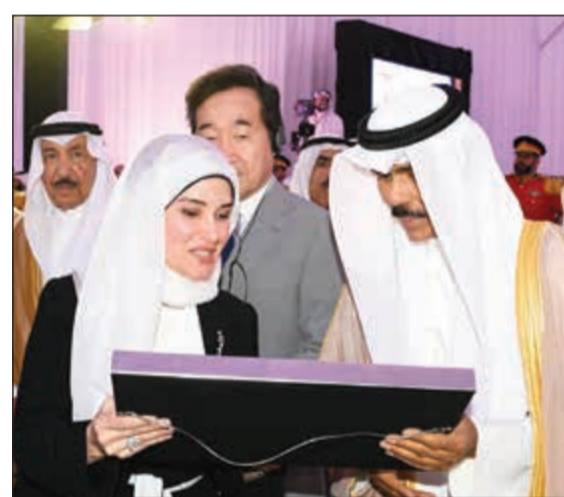
هدية لسمو ولي العهد الشيخ نواف الأحمد

وتتلخص ثالث دلالات هذا المشروع في دخول الكويت في المنافسة العالمية من جديد من خلال تحقيق أرقام عالمية في مجال التنمية الاقتصادية وتشديد البنى التحتية والتفوق على العديد من دول العالم في مشاريع فريدة وعلاقة حيث يعد الجسر رابع أطول جسر بحري في العالم بحسب هيئة الطرق الكويتية وشيد وفقاً لأحدث وأفضل