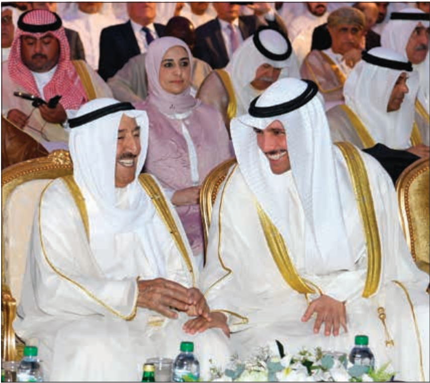
حديث باسم بين صاحب السمو الأمير الشيخ صباح الأحمد ورئيس مجلس الأمة مرزوق الغانم