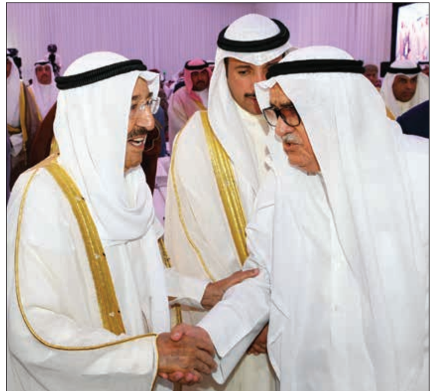
صاحب السمو واحد ذوي شهداء العمل في الجسر

وفي هذا الصدد نتوقع مستقبلاً مشرقاً مليئاً