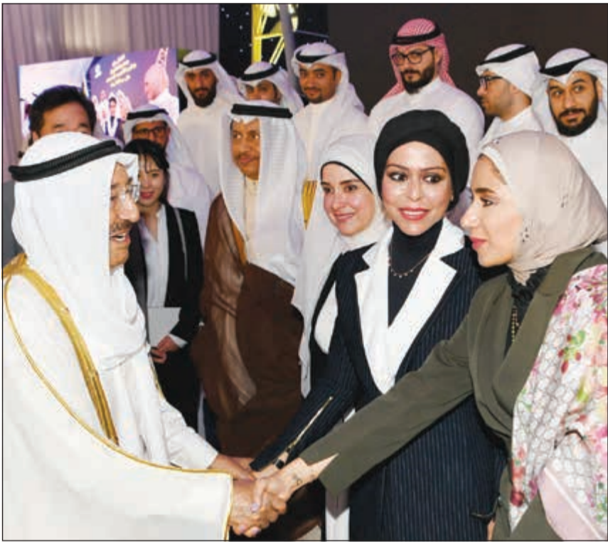
صاحب السمو الأمير الشيخ صباح الأحمد مصافحا مستقبليه