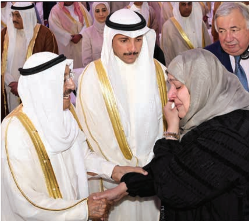
صاحب السمو مصافحا إحدى نوي شهداء الواجب