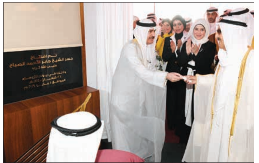
صاحب السمو الأمير الشيخ صباح الأحمد خلال إزاحة الستار إيذانا بافتتاح مشروع جسر جابر الأحمد