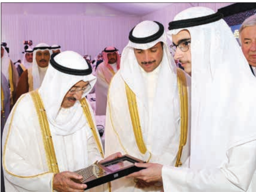
درد لأحد نوي الشهداء