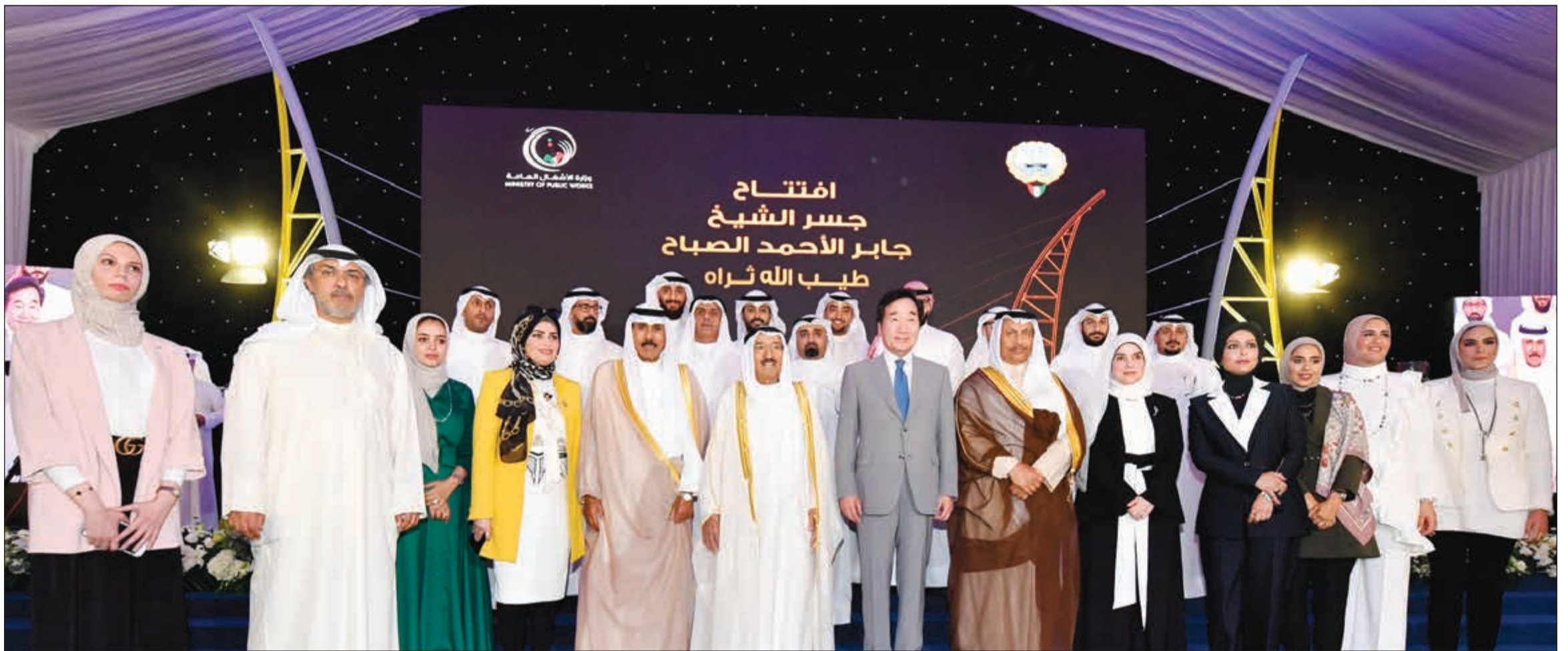
صاحب السمو الأمير الشيخ صباح الأحمد وسمو ولي العهد الشيخ نواف الأحمد وسمو الشيخ جابر المبارك ورئيس وزراء كوريا لي تاكيون ود. جنان بوشهري في صورة تذكارية مع م. سعود النقي وم. مي المسعد وعدد من القائمين على مشروع جسر جابر