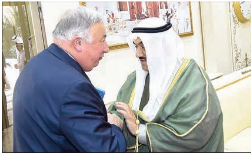
سمو الشيخ ناصر المحمد مرحباً برئيس مجلس الشيوخ الفرنسي جيرارد فيليب رينيه

مطلوبة القوات العراقية بالانسحاب الفوري من الأراضي الكويتية، ومساندة طلب القيادة الكويتية دعوة مجلس الأمن إلى عقد جلسة فوراً، ولم يقف دعم فرنسا للكويت في محتنتها عند حد الإذانة أو الموقف السياسي الثابت، إنما كان لها دور عسكري ضمن قوات التحالف، إذ شارك ما يقارب 18 ألف جندي فرنسي في عملية عاصفة الصحراء لتحرير الكويت، وتقديراً لهذا الدور قام الأمير الراحل الشيخ جابر الأحمد في بيان لها صدر خلال الساعات الأولى من احتلالها على موقعها الثابت، والبدئي في إدانة العدوان،