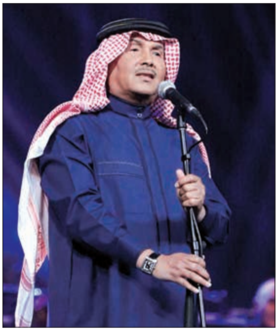
فنان العرب محمد عبده في دار الأوبرا المصرية

ليلة طربية تزين بها المسرح الكبير في دار الأوبرا المصرية مساء أمس الأول، غلغها الإحساس الجميل لفنان العرب محمد عبده، وصوته الذي توج ألحان الموسيقى طلال التي تضمنها اليوم «يا غافية قومي»، وهو أحدث إصداراتها. وبحضور عدد كبير من الجمهور الذي أتى من كل حدب وصوب في أرجاء الوطن العربي وأيضا من مصر، قدم فنان العرب كل أغنيات الألبوم على مدى ساعتين تخللتها استراحة قصيرة، قام فيها عبده بتبديل ملابسه، ليعود محملا بطاقة جديدة لعشاقه ومحبيه ويقدم لهم مجموعة أخرى من الأغنيات، حيث كانت بداية الحفل الذي قاد فرقته المايسترو هاني فرحات بأغنية «أحلى خبر» ويختتم بأغنية الألبوم «يا غافية قومي» وتتوسطها أغنيات «من أكون، مريت، كتبت لك خط، تذكرين، تساو، أستطيع، تضحك معي، أنا سمعت اسمك، الدليل، وأبيك في كلمة»، وكان فنان العرب محمد عبده قد سبق الحفل بعقد مؤتمر صحافي تحدث فيه عن حرصه على التواجد للغناء في دار الأوبرا المصرية كل عام بحفل سنوي يقدم فيه جديده دائما برفقة الموسيقار طلال وإشراف خالد أبو منذر، والأغنيات من شعر الأمير بدر بن عبدالمحسن، ودايم السيف، وفايق عبدالجليل، وفهد عافت وقصيدة من قصائد الشاعر الراحل نزار قباني، أما التوزيع الموسيقي فكان لجيبي الموجي ووجدي فؤاد وحسام كامل