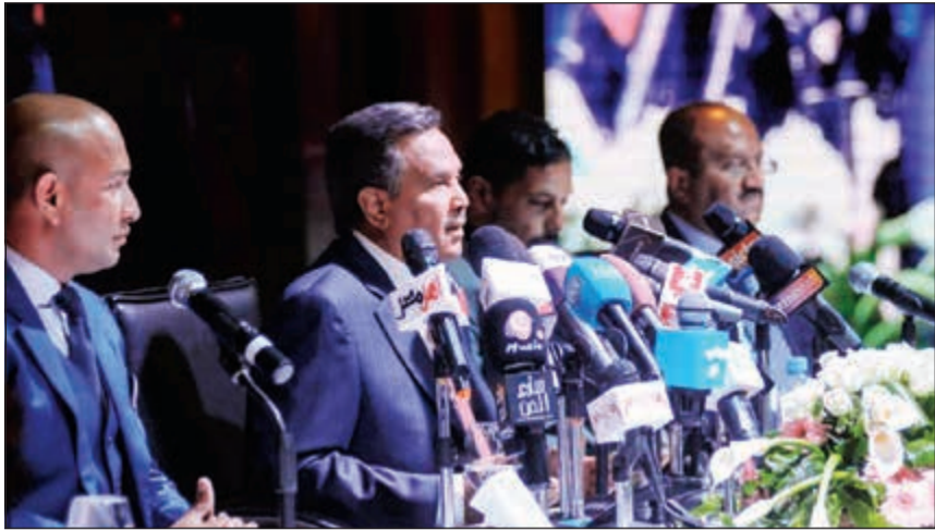
جانب من المؤتمر الصحافي لفنان العرب محمد عبده الذي عقد بالقاهرة

حيث شهد مشواره الفني فترتي توقف فقط، الأولى كانت لأسباب وأمور عائلية والثانية كانت أثناء أزمة الخليج بالغزو الغاشم على الكويت. كما أضاف أن السعودية تعيش الآن حالة ربيع عربي ثقافي، وانفتاح فني وحب ألفة بالمعنى الحرفي تحتاج الكثير من التعقل في طبيعتها لما للمملكة العربية السعودية من خصوصية وروحانية عند جميع مسلمي العالم.