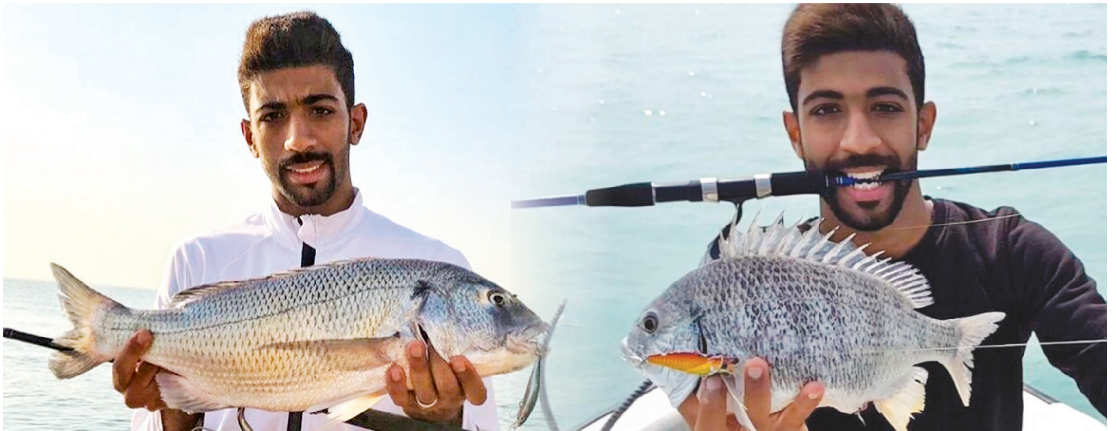
لفاح الأسياف ما بعد الربيع ولغاية أكتوبر