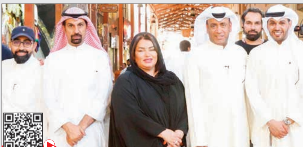
فريق عمل برنامج «مشاوير»