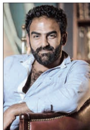
المخرج عيسى ذياب