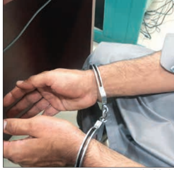
الوافد الباكستاني عقب ضبطه

احتجز وافد آسيوي يعمل سائق شاحنة للتحقيق معه في قضية الشروع في تهريب شخص إلى داخل الكويت بصورة غير شرعية، كما تم توقيف باكستاني لاتهامه بمحاولة الدخول للبلاد بشكل غير شرعي أيضاً، ولم يعرف ما إذا كان المتسلل الباكستاني سيُبعد بعد التحقيق معه بعد الحصول على مستندات أو وثيقة سفر من سفارة بلاده أم سيُحال إلى النيابة، فيما رجح مصدر أمني أن يتم الاكتفاء بإبعاد الباكستاني وحالة سائق الشاحنة إلى النيابة واتخاذ الإجراءات القانونية تجاه الشاحنة التي استُخدمت في التهريب.