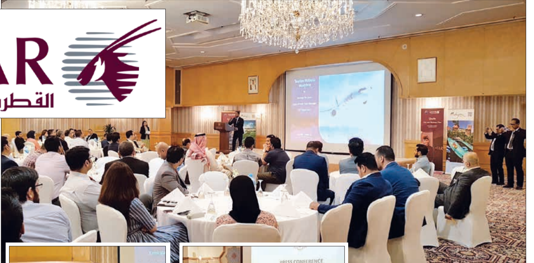
جانب من الحضور خلال ورشة العمل

تشغيل رحلات مباشرة من الدوحة إلى مدينة لنكاوي الماليزية بدءاً من يوم 15 أكتوبر 2019 مختار: قطاع الطيران يساهم بشكل كبير في ازدهار القطاع السياحي الماليزي