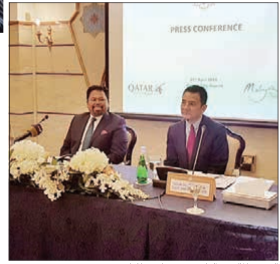
السفير الماليزي الداتو محمد علي سلامات

الكويت حول التنوع الثقافي في ماليزيا، ويفضل رحلات الخطوط الجوية القطرية من الكويت إلى ماليزيا.