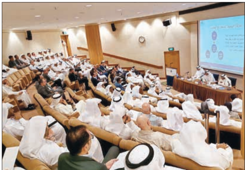
جانب من ورشة العمل

عقدت هيئة أسواق المال أمس ورشة عمل توعوية خاصة تحت عنوان «تعاملات الوسيط المسجل مع عملائه» بمبنى شركة بورصة الكويت، حيث استهدفت الورشة نوعية الأشخاص المرخص لهم لنشاط «وسيط أوراق مالية مسجل في بورصة الأوراق المالية» وممثليه، وكذلك مسؤولو المطابقة والالتزام بطرق وآلية استقبال أوامر البيع والشراء من العملاء في بورصة الأوراق المالية.