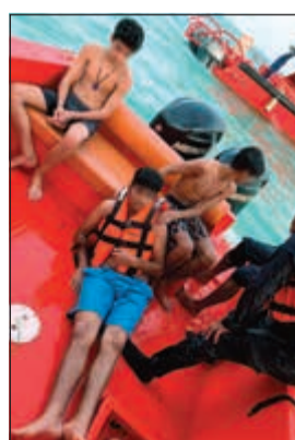
الشباب بعد إنقاذهم

دعت الإدارة العامة للاطفاء مرتادي البحر للسباحة والتنزه إلى استخدام الوسائل المعتمدة للوقاية من الغرق، مشيرة الى ان استعمال أدوات السلامة ومنها سترات النجاة تحميهم من الغرق.