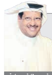
الفريق م. طارق حمادة