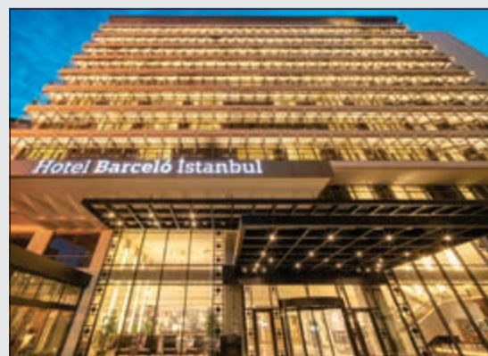
فندق «بارسيلو إسطنبول»