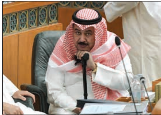
خلف مميثير خلال الجلسة