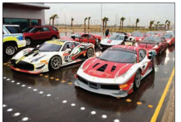
عرض حافل بالتشويق لإمكانات سيارة «تشالنجر 488»