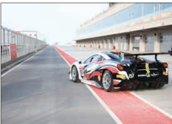
سيارة «تشالنجر 488»