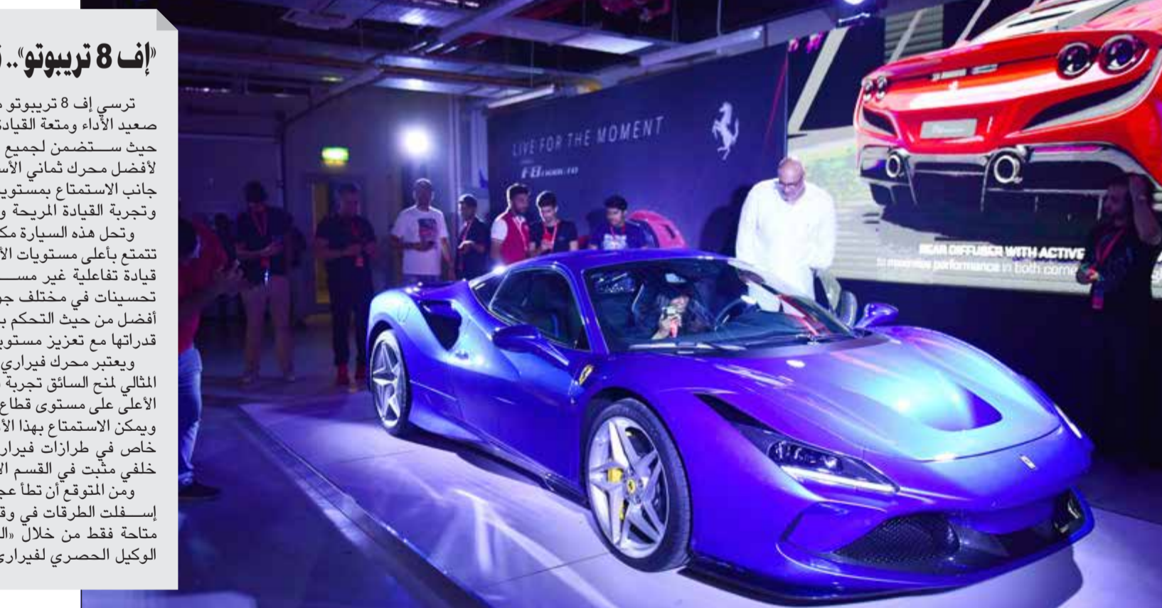
«فيراري إف 8 تريبتو» الجديدة كلياً

ترسي إف 8 تريبتو معياراً جديداً في السوق على صعيد الأداء ومتعة القيادة والتجاوب وسهولة التحكم. حيث ستضمن لجميع السائقين اختبار الأداء الرائع لأفضل محرك ثماني الأسطوانات V8 في العالم، إلى جانب الاستمتاع بمستويات غير مسبوقة من التجاوب وتجربة القيادة المريحة والمتميزة. وتحتل هذه السيارة مكان طراز جي تي بي وهي تتمتع بأعلى مستويات الأداء الذي يقدم للسائق تجربة قيادة تفاعلية غير مسبوقة، وشهدت هذه السيارة تحسينات في مختلف جوانبها، حيث باتت تحقق أداء أفضل من حيث التحكم بالسيارة عند قيادتها بأقصى قدراتها مع تعزيز مستويات الراحة في المقصورة. ويعتبر محرك فيراري ثماني الأسطوانات V8 المحرك المثالي لمنح السائق تجربة قيادة ممتعة وأداء رياضياً هو الأعلى على مستوى قطاع السيارات الرياضية الخارقة، ويمكن الاستمتاع بهذا الأداء الاستثنائي الخارق بشكل خاص في طرازات فيراري المزودة بمقعدين بمحرك خلفي مثبت في القسم الأوسط. ومن المتوقع أن تطا عجلات «فيراري إف 8 تريبتو» إسفلت الطرقات في وقت لاحق هذا العام، وستكون متاحة فقط من خلال «الزياني للسيارات والتجارة»، الوكيل الحصري لفيراري في الكويت.