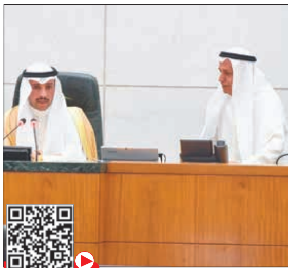
الرئيس الغانم وعبدالله الرومي