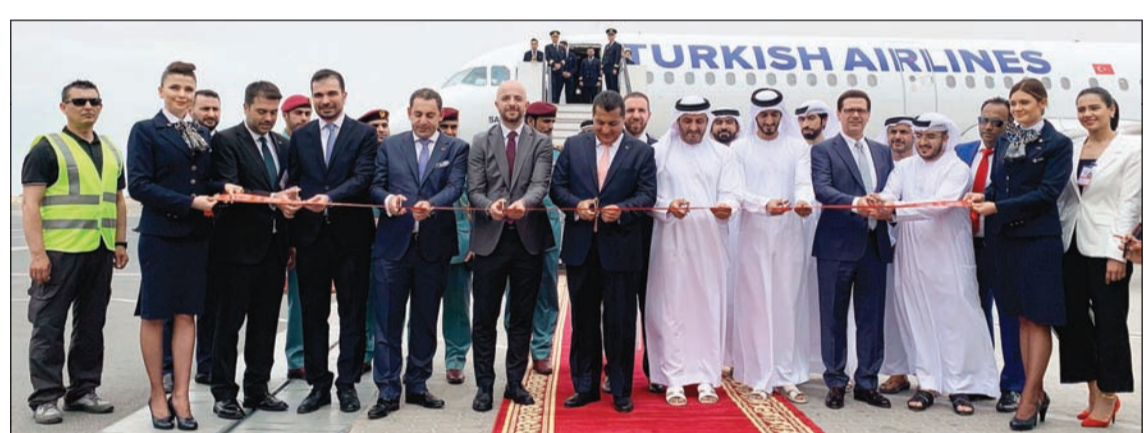
لقطة جماعية لمسؤولي «التركية» وهيئة مطار الشارقة، و«دائرة الطيران المدني»