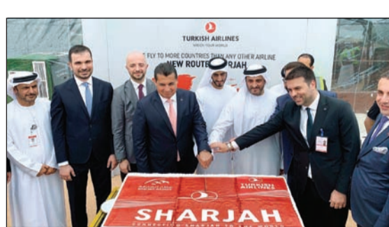
قص كيكة تدينين الرجعة الجديدة

تتابع الخطوط الجوية التركية، التي تسافر لبلدان أكثر من أي خطوط جوية أخرى في العالم، تحسين شبكة رحلاتها الجوية، وبدا الناقل الوطني الأن رحلاته الجديدة إلى الشارقة، أحد أكثر مراكز السياحة شعبية في الإمارات العربية المتحدة، لتصبح الوجهة 307 في الشبكة الواسعة من رحلات هذه العلامة التجارية العالمية.