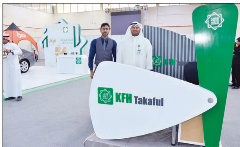
جناح الشركة في المعرض

على تلبية طموحاتهم بما يتماشى مع سياسة «بيتك - تكافل» في طرح منتجات وخدمات نوعية تتوافق مع معايير الجودة وتتطابق مع أحكام الشريعة، حيث ضم المعرض لتصبح أقرب إلى عملائها، وكذلك التعرف على المتطلبات والاحتياجات التي يطرحها العميل ودراسة آرائهم ومقترحاتهم والعمل على توفيرها وتطبيقها للوصول إلى أعلى المعايير في خدمة العميل، والعمل