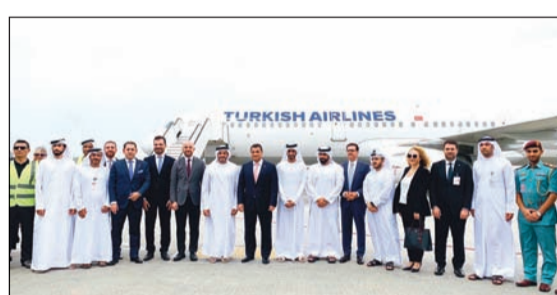
استقبال الطاقم ومسؤولي الشركة على مدرج مطار الشارقة