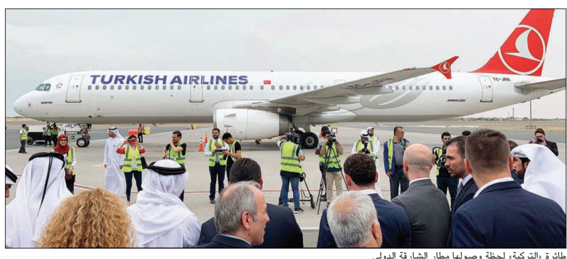
مطارة «التركية» لحظة وصولها مطار الشارقة الدولي

وتعتبر الشارقة، التي تم اختيارها عاصمة للثقافة العربية عام 1998، وجهة ساحلية بعيدة عن حر الصحراء وهي ثالث أكبر إمارة في دولة الإمارات من ناحية المساحة وعدد السكان. بحداتها وعراقتها، بازديادها وهدونها، يجذب ثراء التاريخ والثقافة والاقتصاد في الشارقة المسافرين إليها باستمرار.