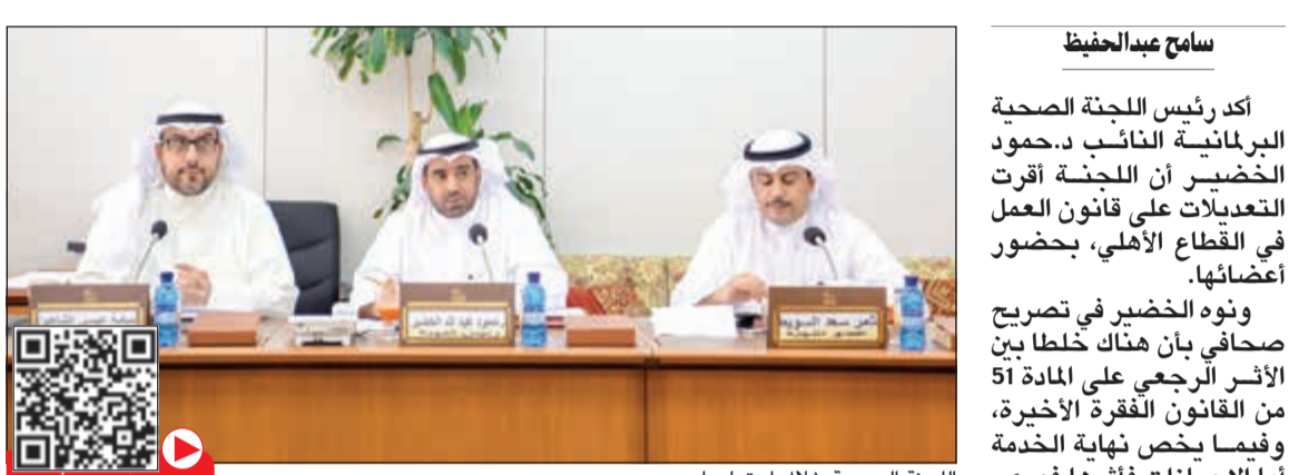
اللجنة الصحية خلال اجتماعها

وأضاف الخضير «إنه تم إقرار القانون، والتعديل تعلق فقط بالإجراءات الخاصة بالعمال الكويتيين كونهم مسجلين في التأمينات الاجتماعية».