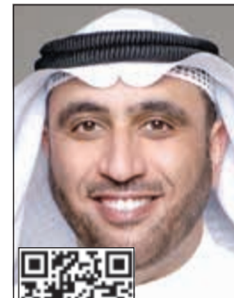
د. محمد الدلال

كشف النائب د. محمد الدلال عن تسويق نيابته لاتخاذ العديد من الخطوات الجادة لمتابعة قضية التلاعب في قيود الناخبين. وقال الدلال في تصريح بالمركز الإعلامي لمجلس الأمة إن موضوع نقل القيود الانتخابية شائك وتتدخل فيه عدة أطراف، وفي النهاية هو تزوير إرادة الناخبين. وأوضح أن بعض المواطنين في عدد من المناطق وخصوصاً في منطقة جنوب السرة اكتشفوا أن هناك أسماء يقرر عددها بين 40 و60 شخصاً مسجلين على نفس القسيمة. وتساءل الدلال «من المسؤول عن نقل هؤلاء من مناطقهم السكنية والسماح لهم بعمل قعود وهمية يتم اعتمادها من قبل بعض المختارين؟، مبيناً أنه بناء على ذلك يذهب هؤلاء إلى هيئة المعلومات المدنية لاستخراج بطاقات مدنية وبالتالي يتم تسجيلهم بالقيود الانتخابية ثم بعد عدة أشهر يغيرون بطاقاتهم المدنية ويعودون إلى مناطقهم السكنية الأصلية». وأشار إلى أن الغرض من ذلك هو الانتقال من دائرة إلى أخرى للتصويت لمرشح ما دون النظر إلى أن ذلك تزوير لإرادة الأمة، وجعل مجلس الأمة رهينة لمن يشتري الصوت بالدينار.