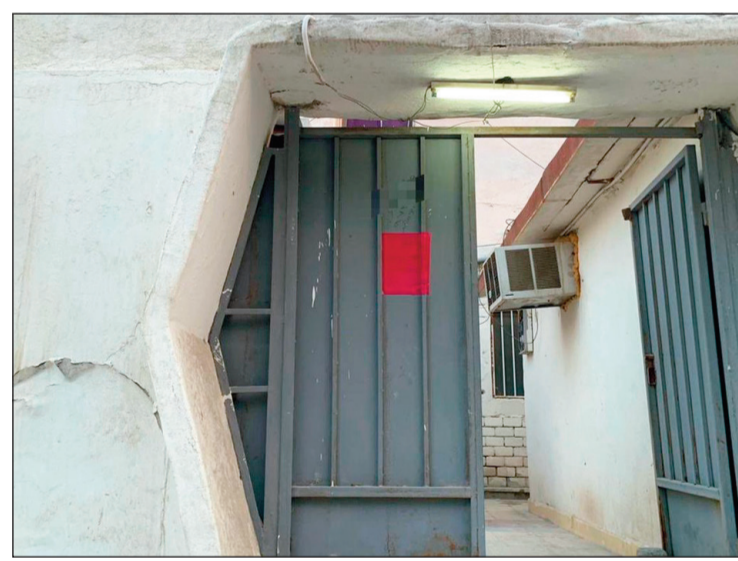
توجيه أحد الإنذارات لسكن عزاب في حوالي

في إطار الجهود المتواصلة لتنفيذ القوانين واللوائح والحفاظ على المظاهر الجمالية في مختلف المدن والمناطق، قام فريق طوارئ بلدية محافظة حولي بعمل عدة جولات ميدانية أسفرت عن توجيه 17 إنذاراً لوجود عزاب في مناطق السكن الخاص، كما تم تحرير 4 محاضر للباع المتجولين وكرفانات متنقلة بالإضافة الى توجيه 3 إنذارات تعدي على املاك الدولة وتحرير محضر استغلال مساحة خارجية على املاك الدولة.