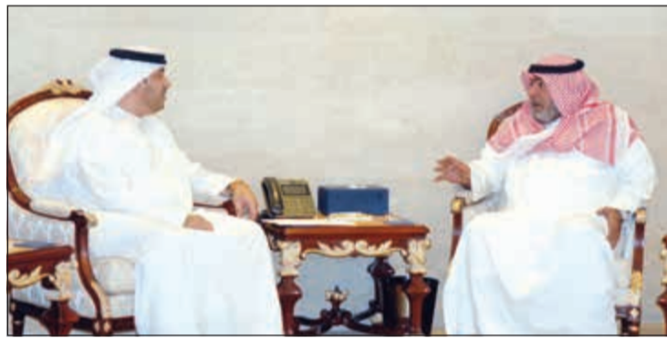
الشيخ ثامر العلي خلال اجتماعه مع السفير صقر الرئيسي