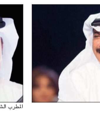
المطرب الشاب أحمد الرويشد