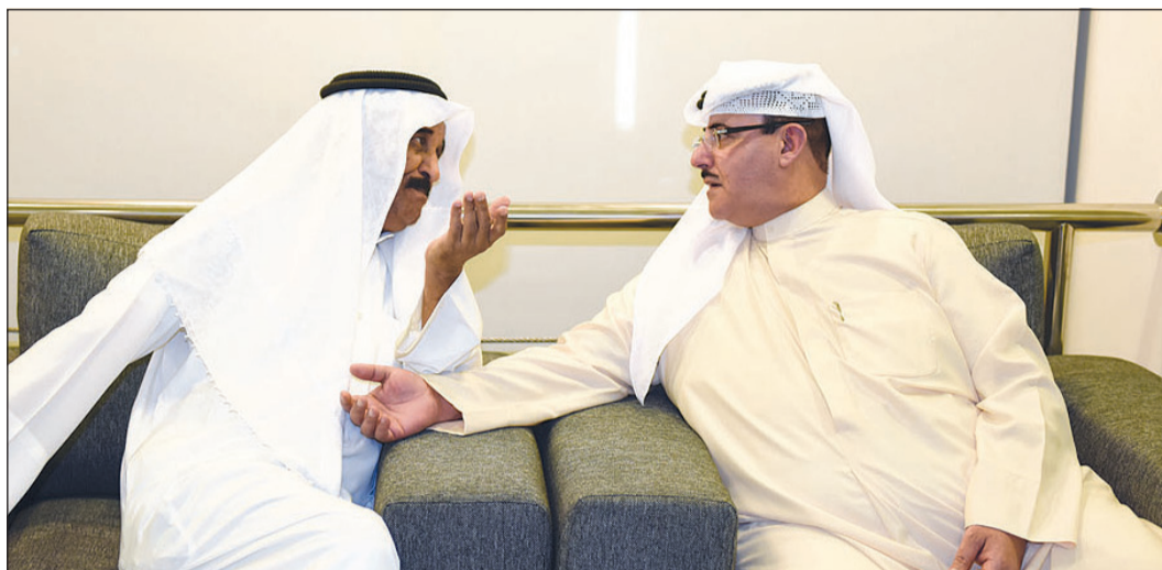
الشيخ فهد المبارك مع الفنان القدير محمد جابر