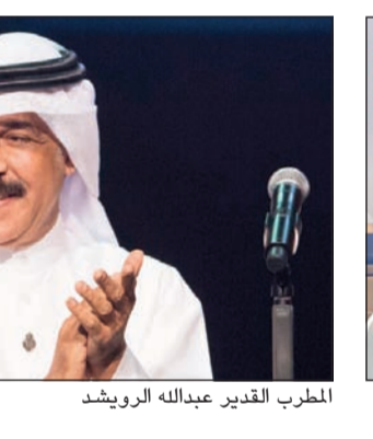
المطرب القدير عبدالله الرويشد