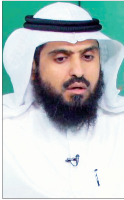
الشيخ د.عدنان الرشيدى

يقول الله تعالى: (وَأَلْفَ بَيْنَ قلوبهم لو أنفقت ما في الأرض جميعاً ما ألفت بين قلوبهم ولكن الله ألف بينهم إنه عزيز حكيم) فالاجتماع والاتفاق مطلب ضروري لا غنى عنه، كما أكد على ذلك الشرع الحنيف، حول كيفية التعامل مع الخلاف على أسس شرعية صحيحة وليس على آراء واجتهادات خاصة لفئة أو طائفة تعزف على هذه الآراء.