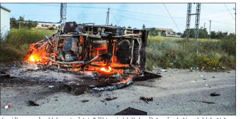
صورة نشرتها قوات حفتر لعربة محترقة جراء المعارك في منطقة العزيزية جنوبي طرابلس أمس

وأوضح سكان أن طائرات الجيش الوطني تحلق فوق طرابلس وتحدثون عن أصوات اشتباكات في ضواحي المدينة. وشهد مطار طرابلس الدولي، الخارج عن الخدمة منذ عام 2014، الواقع على بعد 30 كيلومتراً جنوب طرابلس، معارك أبصار. وشهدت مناطق تقع على بعد عشرات الكيلومترات جنوب شرق طرابلس معارك، حيث سُمع إطلاق كثيف للذخائر في منطقة عين زارة. وتحدث بعض السكان عن وضع قوات حكومة الوفاق سواتر ترابية لقطع الطرق والقاطعات الرئيسية.