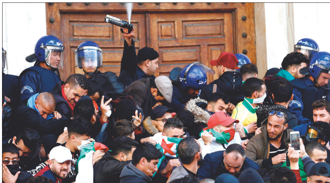
شرطي يواجه المحتجين على تعيين الرئيس المؤقت عبدالقادر بن صالح بالغاز المسيل للدموع في الجزائر أمس

وأشار الفريق قايد في كلمة ألقاها في هيران أمام قادة المنطقة الشمالية الغربية إلى أن العيلة وبعد استرجاعها لكل صلاحياتها، منتظر منها