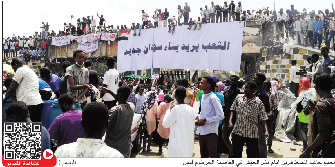
تجمع حاشد للمتظاهرين أمام مقر الجيش في العاصمة الخرطوم أمس

من جهته، أكد وزير الدفاع السوداني الفريق ركن عوض بن عوف أن «القوات المسلحة تقدر أسباب الاحتجاجات وهي ليست ضد تطلعات وطموحات وأمان المواطنين، لكنها لن تسمح بانزلاق البلاد نحو الفوضى ولن تتسامح