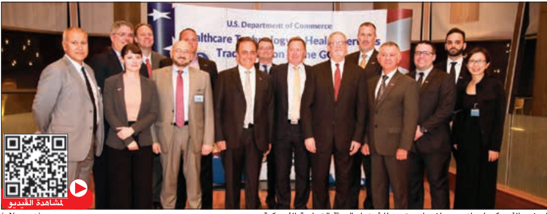
السفير الأمريكي لورانس سيلفرمان متوسلا أعضاء البعثة التجارية الأمريكية