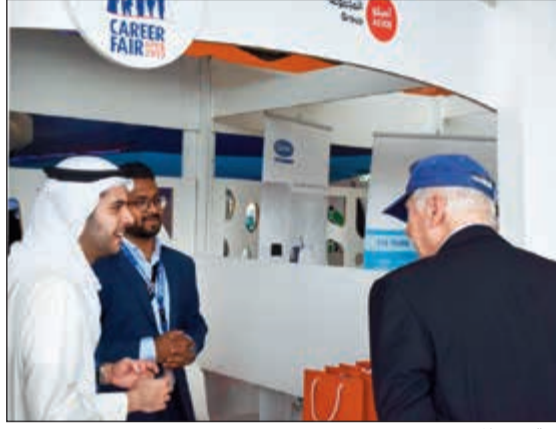
جناح «أسيكو المجموعة» في المعرض