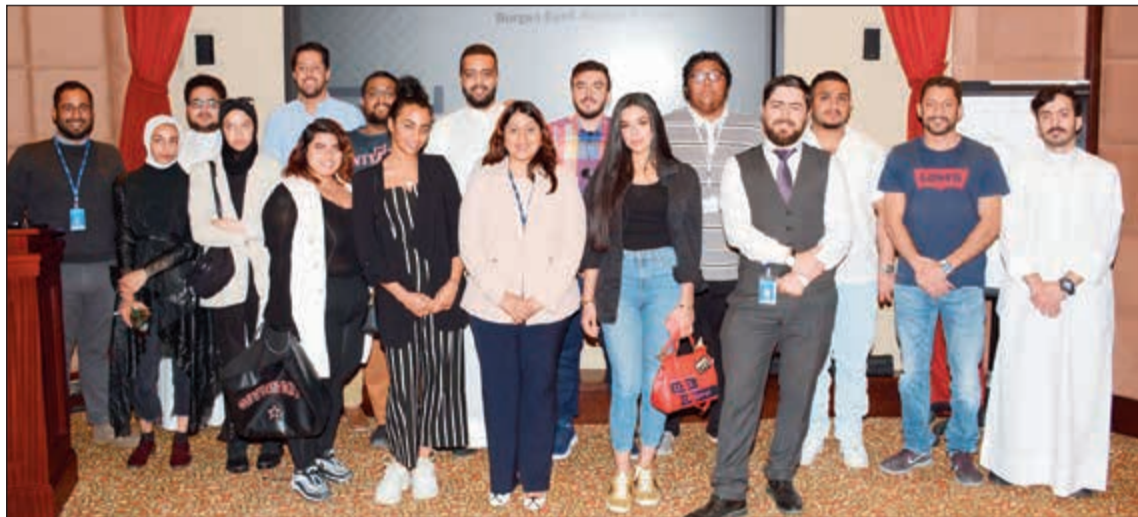
صورة جماعية لطلاب الكلية الأسترالية مع ممثلي البنك

وللتعرف عن كخب على مختلف قطاعات وإدارات البنك، حيث شارك في هذه الورشة ممثلو إدارة الأعمال والتطوير، من مكتب المصرفية للشركات، وعلاقات العمليات الدولية، حيث قامت المستثمرتين بالمشورة في كل إدارة بتوضيح وشرح المتعلقات المهنية المختلفة بالإضافة إلى ثقافة وأهداف البنك. وقد تفاعل الطلبة مع المواضيع المطروحة وقاموا بطرح الأسئلة عن القطاع المصرفي بما استعدوا بالفائدة عليهم وعلى دراستهم.