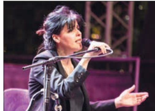
سعاد ماسي في الحفل

اختتمت أكاديمية لويك للفنون الأدائية «لأب» فعاليات النسخة الثالثة من فعاليات مهرجان الشباب العربي بحفل غنائي ضخم للفنانة الجزائرية سعاد ماسي وذلك مساء امس الأول بالتعاون مع حديقة الشهيد. بدأت الفنانة ماسي بأغنية «Le Bien Et Mal» وغنت باقة من الأغاني التي أشعلت المسرح طربا وتفاعلا مع الجمهور منها «دار جدي»، و«كل يوم»، و«ديب»، و«حياتي»، و«طلبت على البير»، و«يا قلبي»، و«أين»، و«غير أنت»، و«يا وليدي»، و«نوصيك يا قلبي»، و«خلوني»، و«راوي». من جانبها أكدت رئيس مجلس إدارة لويك للشباب وأكاديمية لويك للفنون الأدائية «لأب» - فارة السقايف أن المهرجان يهدف لتمكين الشباب العربي بكل اختلافاته في مجال الفنون وتسلط الضوء عليهم لإنعاش الثقافة والفن في الكويت باستقطاب المواهب الشابة المحلية والعربية لتبادل الخبرات، مشيدة بالتعاون المشترك مع الشباب لإثراء المشهد الثقافي والفني في البلاد.