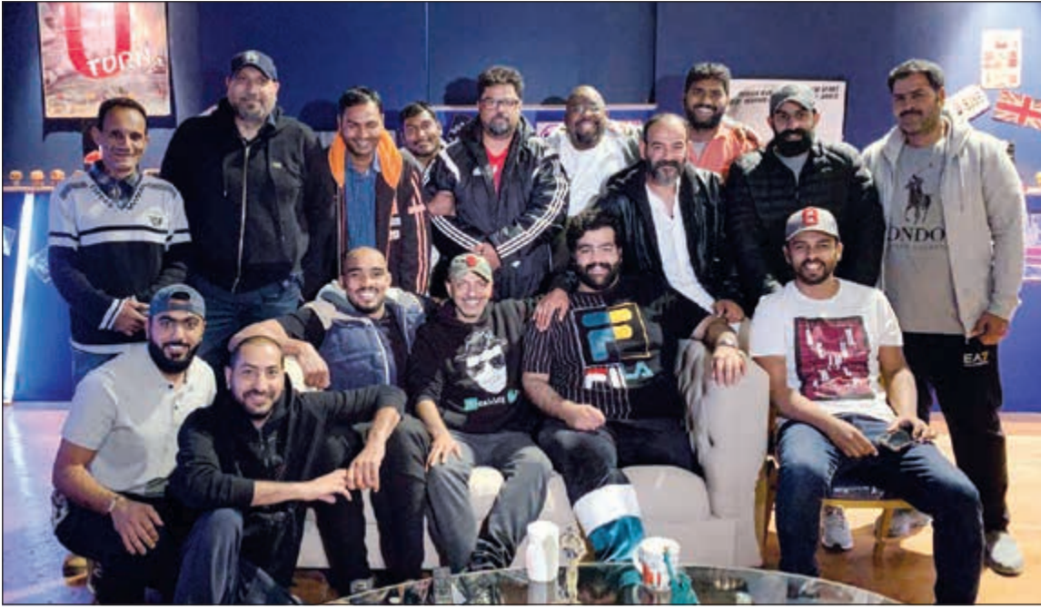
لقطة جماعية لفريق برنامج «محطات»

فكرة وإخراج نواف سالم الشمري وبدعم من وكيل التلفزيون ويعرض الليلة