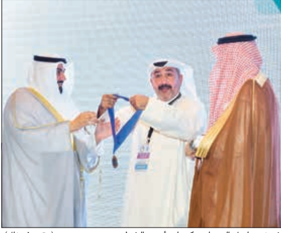
الشيخ د.باسل الصباح مكرما د.أحمد الشطي (متمن غوزال)

على أكثر من صعيد، مضيافا: نجتمع اليوم والواقع الصحي العربي مخزن بجراحات الأمراض وآلام الأجساد والآنفس، نجتمع وسط تحديات مرضية ووبائية متزايدة في ظل واقع طبي واستشفائي صعب وضعيف أحيانا ما يدفع بالكثير من مواطنينا إلى تكبد معاناة وأعباء السفر للعلاج في أوروبا وغيرها، هو واقع غير قادر حتى الآن على توفير الخدمة الصحية بمستوى جيد إلى قسم كبير من الشعب، واقع عربي أنهكته الحروب والجراحات والآلام وأعداد متزايدة من المرضى والمعوقين، وطالب بعقد اجتماع عاجل على مستوى وزراء الصحة العرب لوضع الإمكانيات على الطاولة والاتفاق على بروتوكولات بالتزامن مع وضع جدول زمني للمراحل لجهة دعم وتمويل مشاريع طبية واستشفائية ودوائية على مستوى عالمنا العربي، تخفف من آلام أهلنا ومواطنينا، على أن نبداً بإجراءات معقولة وذات