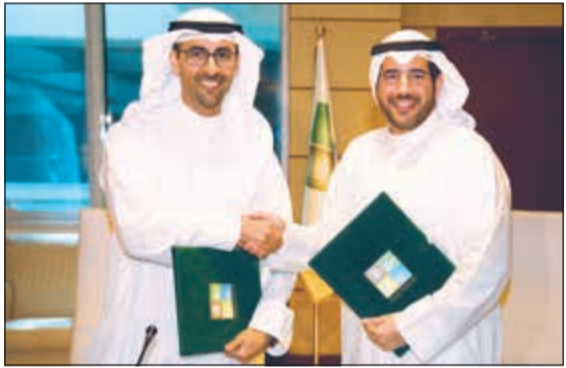
الشيخ عبدالله الأحمد والشيخ نواف السعود عقب توقيع مذكرة التفاهم

في المنطقة الجنوبية، كما أنه صدر قرار من قبل المجلس الأعلى للبيئة لوقف أي زيادة للمصانع في المنطقة الجنوبية لحين الانتهاء من هذه الدراسة.