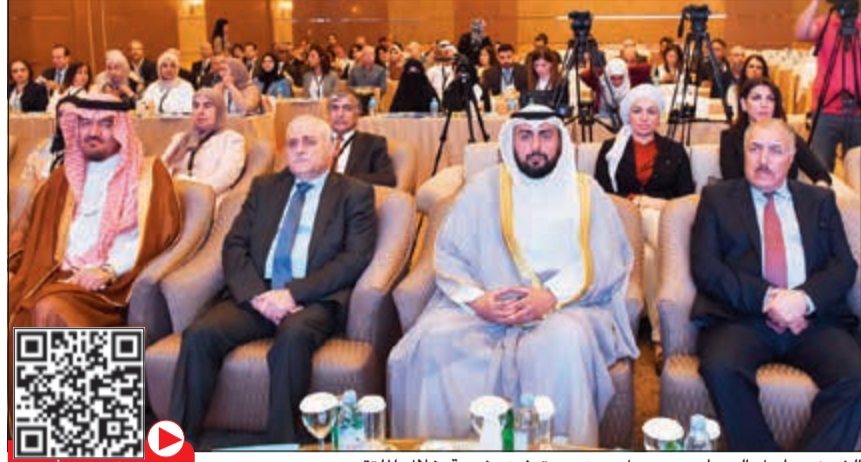
الشيخ د.باسل الصباح ود.جميل جبق ود.توفيق خوجة خلال الملتقى

أعلن وزير الصحة الشيخ د.باسل الصباح عن قرب طرح الوزارة للقانون الخاص بالمسؤولية الطبية على الجهات المختصة ممثلة في «الفتوى» ثم مجلس الأمة تمهيدا لإقراره. وقال الصباح، في تصريح له على هامش افتتاح الملتقى الـ 21 لاتحاد المستشفيات العربية، إن الملتقى يناقش الحوكمة الرشيدة والشفافية والمسائلة والإنتاجية الفعالة والإبداع، كمنطلق للتطوير المستمر لأداء المستشفيات والنظم الصحية، وتحقيق المزيد من الإنجازات، لافتا إلى أن اختيار تلك الموضوعات يجسد الرؤية الثاقبة، وحرص اتحاد المستشفيات العربية على مواكبة المستجدات العالمية، وتبادل الخبرات بين القيادات والمتخصصين، مشيرا إلى أن المناقشات من شأنها أن تضع الملامح الرئيسية لخارطة الطريق وتستشرف آفاق المستقبل لجابهة التحديات