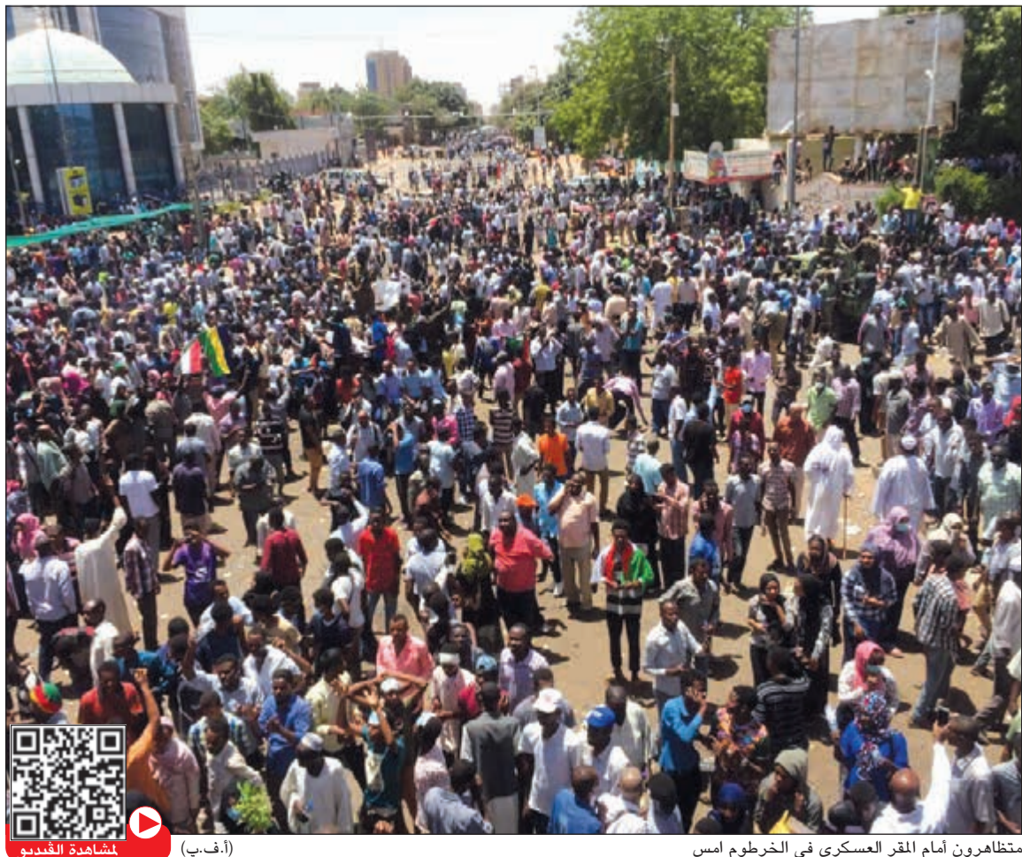
متظاهرون أمام المقر العسكري في الخرطوم امس

عواصم - وكالات: نفى وزير الإعلام والاتصالات السوداني الناطق الرسمي باسم الحكومة حسن إسماعيل التقارير الإعلامية التي تحدثت عن أن الرئيس عمر البشير بات أقرب إلى تسليم السلطة للجيش. وأكد إسماعيل في بيان أمس أن هذه المعلومات عارية من الصحة تماماً، ولم تنم مناقشة مثل هذا الموضوع أصلاً، وأن مثل هذه المزاعم هدفها إثارة البلبلة وسط المواطنين. من جهته، اتهم النائب الأول للرئيس ووزير الدفاع السوداني الفريق أول ركن عوض محمد بن عوف جهات لم يسماها بمحاولة استغلال الاحتجاجات الشعبية لإحداث شرخ داخل القوات المسلحة. وقال بن عوف في كلمة خلال لقائه مع قادة الجيش بمقر وزارة الدفاع، نقلتها وكالة الأنباء السودانية الرسمية (سونا)، إن الجيش يقدر أسباب الاحتجاجات، وهو ليس ضد تطلعات المواطنين، لكنه لن يسمح بانزلاق البلاد نحو الفوضى، ولن يتسامح مع التفتت الأمني. بدوره، أكد رئيس الأركان الفريق أول كمال عبدالمعروف، أن الجيش لن يسمح بانزلاق البلاد نحو الجهول وأنه لا مجال لاستهداف الجيش والمزايدة على مواقفه. وكان بيان لـ «تحالف الحرية والتغيير» المنظم للاحتجاجات قد دعا