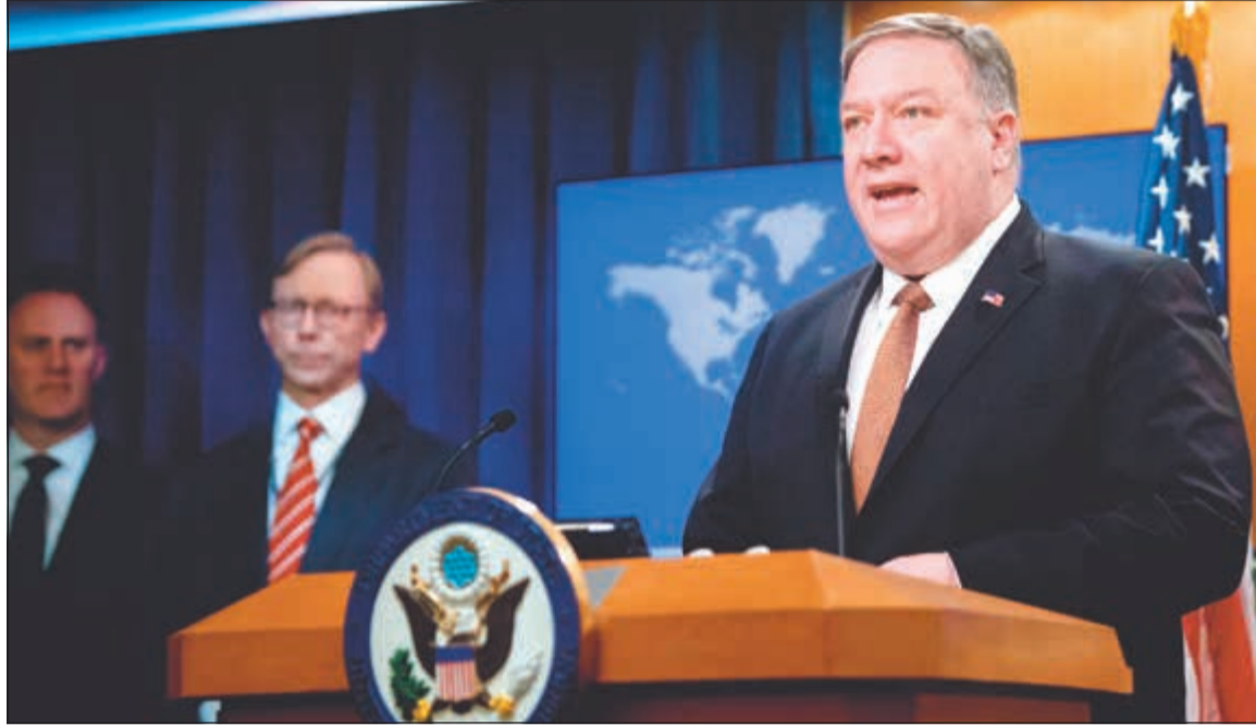
وزير الخارجية الاميركي مايك بومبيو متحدًا خلال مؤتمر صحافي للتعليق على قرار ترامب حول الحرس الثوري أمس

روحاني يحضه على القيام بذلك، حسب بيان لوزارة الخارجية صدر بعيد الإعلان الأميركي. في سياق آخر، انضمت وزيرة الامن الداخلي الاميركي كريستن نيلسن الى مجموعة كبيرة من الوزراء والمسؤولين الذين غادروا مناصبهم في حكومة ترامب، حيث أعلن وزير الامن الداخلي الاميركي كريستن نيلسن من امس أن نيلسن ستغادر منصبها، معبرا بذلك عن استيائه المتزايد من العقبات التي تقف أمام سياسته بشأن الهجرة، في وقت يبلغ عدد المهاجرين غير القانونيين الموقوفين أعلى مستوياته. وكتب ترامب في تغريدة مقتضبة مساء اول من امس أن «وزيرة الامن الداخلي كريستن نيلسن ستغادر منصبها، وأود أن أشكرها على خدماتها». وأضاف أن كيفن ماككينا، المفوض الحالي للجمارك وحماية الحدود، سيجل محل نيلسن وسيصبح وزير الامن الداخلي بالوكالة. وكان الرئيس الأميركي توجه الجمعة الماضي مع كريستن