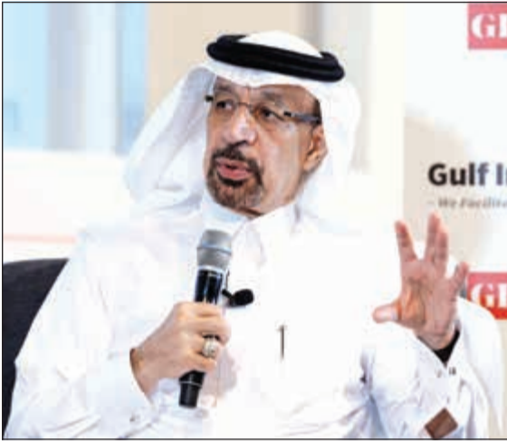
خالد الفالح يتحدث خلال منتدى الطاقة في الرياض

رويترز: كشف وزير الطاقة والصناعة والثروة المعدنية السعودي م. خالد الفالح أمس أنه سيتم ربط الكويت وعمان بشبكة الغاز في المملكة عبر أنبوب يربط الدولتين بالشبكة، مؤكداً «بدأنا الدراسات الفنية في هذا الخصوص».