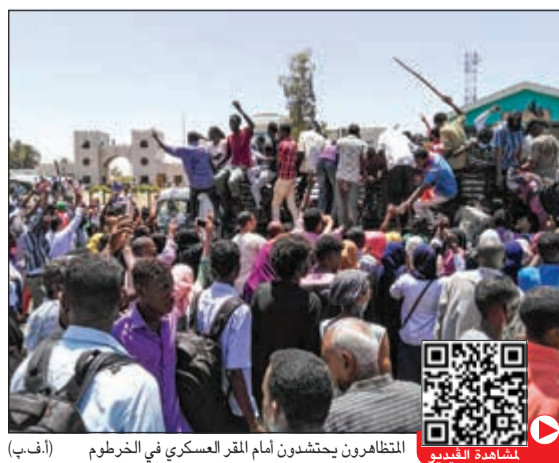
المتظاهرون يحتشدون أمام المقر العسكري في الخرطوم

«القوات المسلحة لدعم خيار الشعب السوداني في التغيير والانتقال إلى حكم مدني عملية الانتقال السياسي وتسليم السلطة لحكومة مدنية انتقالية متوافق عليها شعبياً ومعبرة عن قوى الثورة».