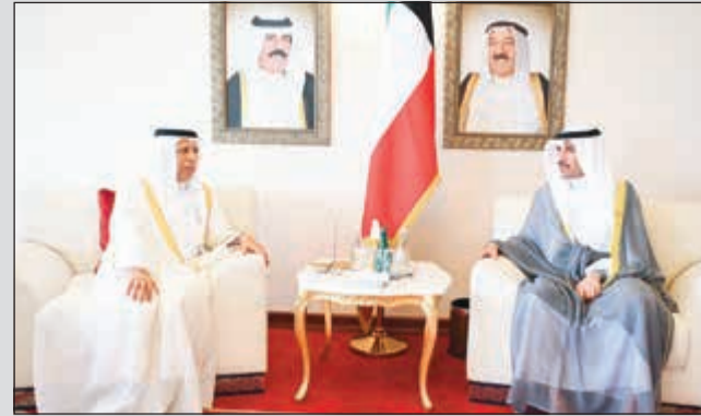
رئيس مجلس الأمة مرزوق الغانم لدى اجتماعه مع رئيس مجلس الشورى القطري أحمد بن عبدالله آل محمود

الغانم يجتمع في الدوحة مع رئيس «الشورى القطري» والمتحدثة باسم «الخارجية» القطرية ووكيل سكرتير عام الأمم المتحدة لشؤون الإرهاب 11