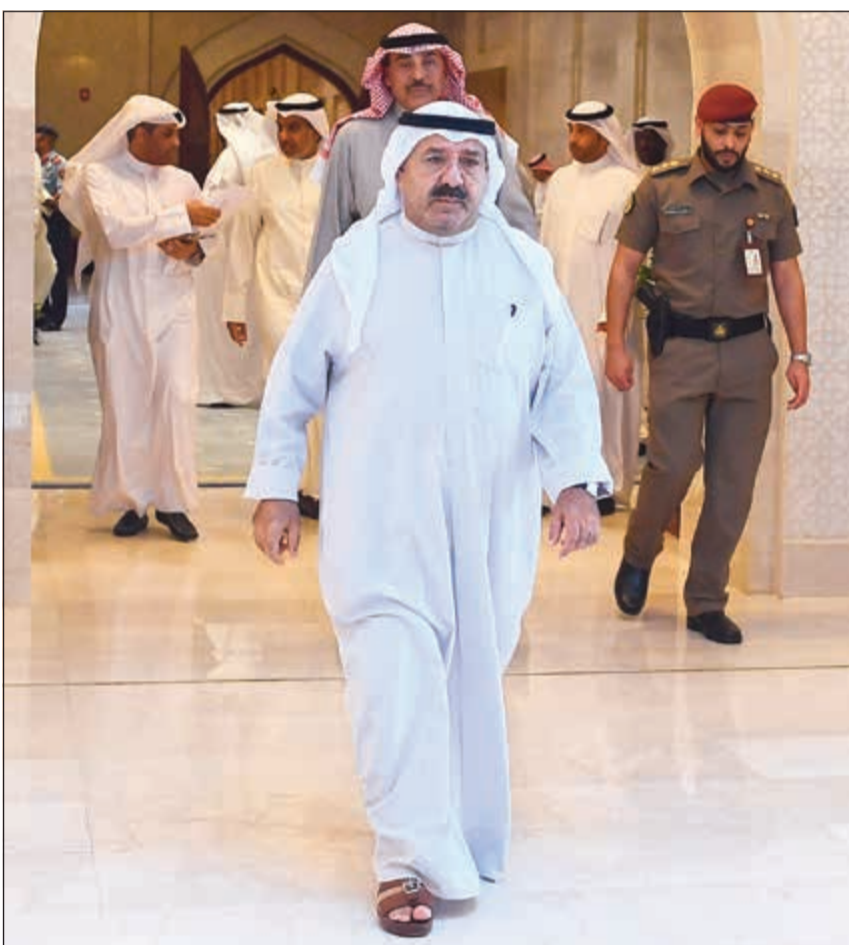
الشيخ ناصر صباح الاحمد والشيخ صباح الخالد في طريقهما إلى الاجتماع الأسبوعي

وحول ما يتردد عن عدم تنفيذ الإحلال بالشكل الطموح لتوفير الوظائف الحكومية للخريجين الجدد، ذكرت المصادر أن ديوان الخدمة المدنية أعد الدراسة المطلوبة للعام المالي 2020/2019 وحدد فيها الوظائف المشمولة بالتكويت والنسبة المئوية لعدد الموظفين الكويتيين التي ينبغي تحقيقها من إجمالي الموظفين، موضحة أن العدد المطلوب لن يقل عن 3000 وافد. واستطردت المصادر قائلة: إن خطط الإحلال تنفذ زمنياً بحسب القرار رقم 11 لسنة 2017 الذي أصدره رئيس مجلس الخدمة المدنية بالنيابة أنس الصالح وأن القرار يهدف إلى تكويت أكثر من 30 مجموعة وظيفية بعضها بنسبة 100٪ وتدرج هذه النسبة خصوصاً لوظائف التعليم والصحة.