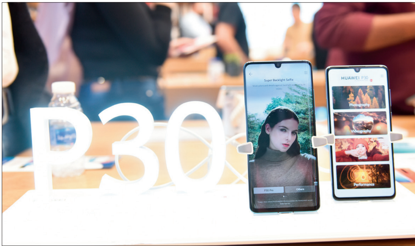
لقطة للهاتف الجديد من هواوي P30