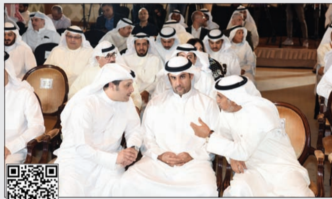
حديث مشترك بين الوزير فهد الشعلة والنائبين يوسف الفضالة وأحمد الفضل على هامش المؤتمر

المنفوحى: ربط 13 موقعا بالأقمار الاصطناعية للتحكم في قياسات ترسيم حدود العقارات