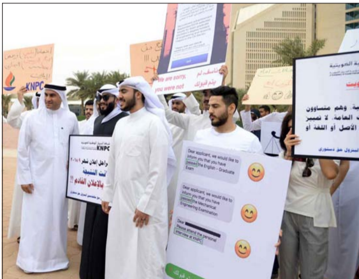
عدد من المهندسين والمهندسات خلال اعتمامهم أمام مؤسسة البترول لعدم تعيينهم رغم اجتيازهم اختبارات «الإنجليزي» والتخصص