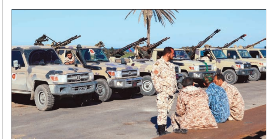
مدرعات وعناصر من قوات مصراتة المؤيدة لحكومة الوفاق خلال تمرکزها شرقي طرابلس أمس الأول