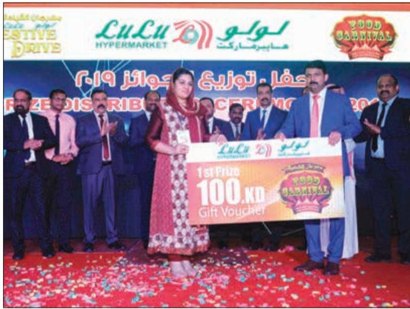
فائزة بجائزة 100 دينار