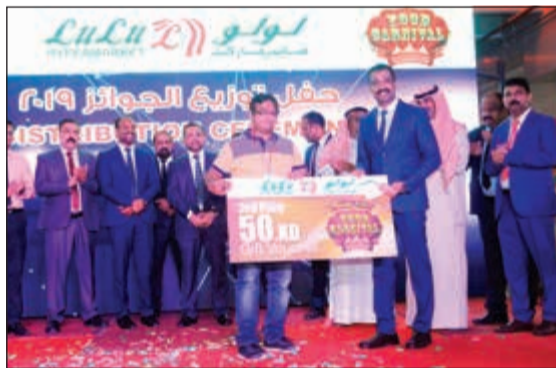
أحد الفائزين بجائزة 50 ديناراً