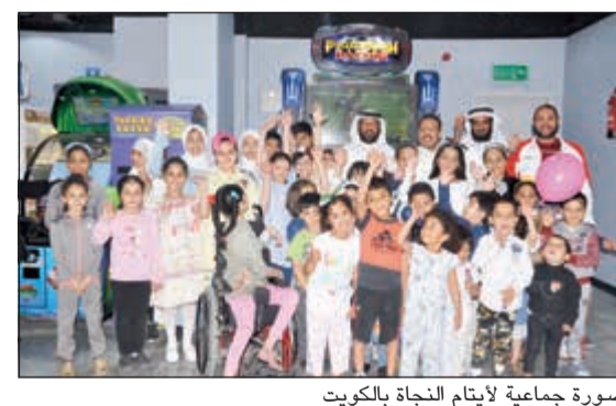
صورة جماعية لأيتام النجاة بالكويت