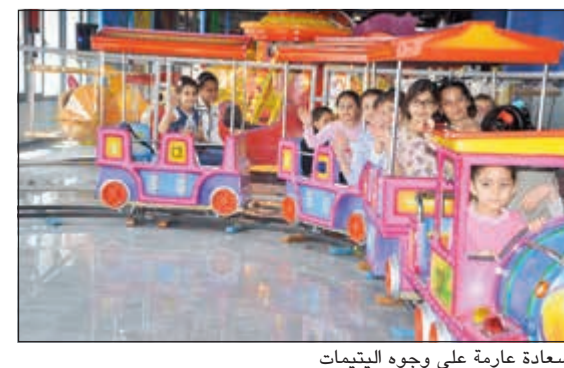
سعادة عارمة على وجوه اليتيمات

وتابع: تخلق الإحتفالات التي أقامتها الجمعية أنشطة ترفيهية وترويحية وكذلك توزيع الجوائز التشجيعية، والتي ساهمت بدورها في