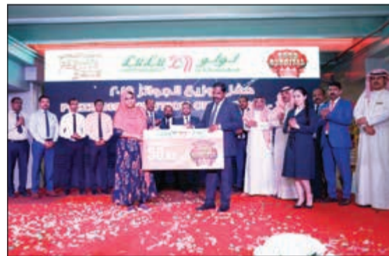
50 ديناراً جائزة لإحدى الفائزات