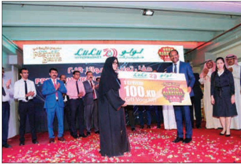
فائزة تتسلم جائزتها من «لولو هايبر ماركت»