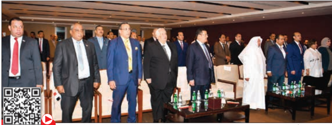
الحضور وقوفاً أثناء السلام الوطني خلال ندوة تعديل الدستور المصري