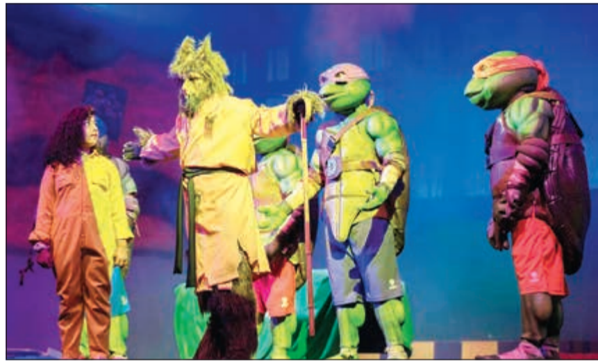
جانب من المسرحية