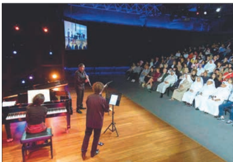
جانب من الأمسية