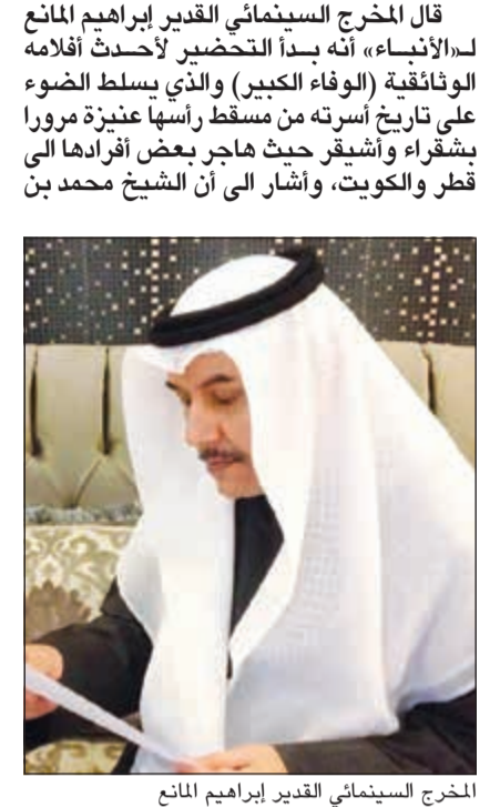
المخرج السينمائي القدير إبراهيم المانع

عبدالعزیز المانع هو أحد رواد النهضة العلمية في دول الخليج حيث ترأس النادي الإسلامي في البحرين عام 1913 للرد على النصارى والحملات التبشيرية التي انتشرت في تلك الفترة، كما ولاة أمير قطر الشيخ عبدالله آل ثاني عام 1915 القضاء والتدريس والخطابة وتم تعيينه في عهد الملك عبدالعزیز رئيساً لدار التوحيد ومديراً عاماً للمعارف عام 1943، وكان للشيخ محمد دور في السماح للنساء بالتعليم في قطر وأن هذا لا يتعارض مع تعاليم الدين الإسلامي. وقد حصل البروفيسور عبدالعزیز بن ناصر المانع على جائزة الملك فيصل عام 2009 وقررت جامعة الملك سعود تخصيص كرسي بحث باسمه في مجال اللغة العربية وآدابها، وذكر بأن الأسرة في كان لها دور في الاقتصاد القطري منذ بداياته حيث ساهمت ولا تزال في التنمية المستدامة لدولة قطر الشقيقة. وكما كانت الأسرة ودية لوطنها كانت ودية لبعضها البعض حيث تتبعت وجمعت شجرة العائلة لتلتقي في أول اجتماع تواصلى تراحمي عام 2009 حيث تكررت هذه اللقاءات وكان آخرها في الكويت وقد أشارت له الصحافة الكويتية، وأضاف أن هذا أقل واجب أقدمه لأسرة تشرفت بالانتماء لها، أسرة أدرت قيمة العمل وخدمت الوطن.