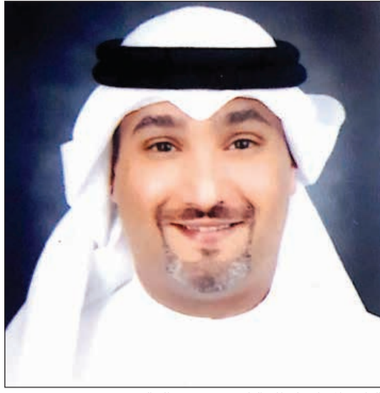
الوكيل المساعد لقطاع التلفزيون سعود الخالدي