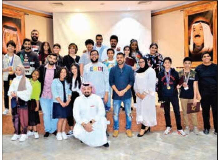
لقطة جماعية للمشاركين في الموسم الثاني من أكاديمية ستارز للفنون