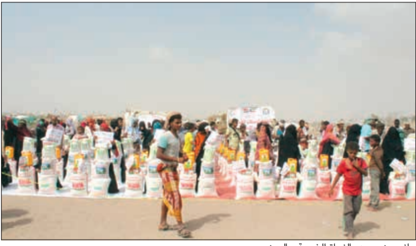
جاناب من جهود «النجاة الخيرية» باليمن

في إطار حرصها الشديد على دعم ومساندة الأشقاء اليمنيين، قامت جمعية النجاة الخيرية بتوزيع أكثر من 1000 سلة غذائية بالمحافظات اليمنية التي يكثُر فيها وجود النازحين وهي عدن ولحج وأبين، حيث تكفي السلة الواحدة أسرة من 4 أفراد لمدة شهر كامل.