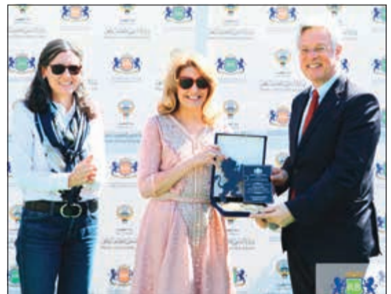
د.حنان المطوع تكرم سفير ألمانيا لدى الكويت كارل فريدريغ برغتر