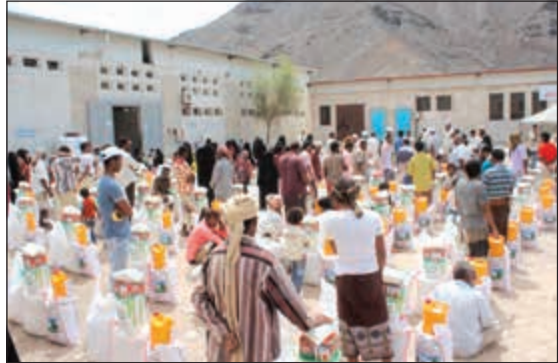
إشراف مباشر على توزيع المساعدات وتوثيقها

بالمسح الميداني لهذه الأسر الفقيرة بالمخيمات، ومن ثم تتم مخاطبة الجمعية بعدد الأسر المستفيدة، والغذائية والتي تحتوي على المواد الغذائية الضرورية منها كيس من الدقيق 25 كغ، وكيس من البر المطحون 25 كغ، وأرز 10 كغ، وسكر 10 كغ، وزيت 4 لترات، وحليب بودرة وصلصة وفول وغيرها من الاحتياجات الأخرى. وحول آلية التوزيع في ظل الأوضاع الإنسانية الصعبة التي تعيشها اليمن، أجاب الوئدة: نتعاون مع جهات رسمية ومعتمدة باليمن الشقيق منها مؤسسة يبابيع الخير، والتي تقوم