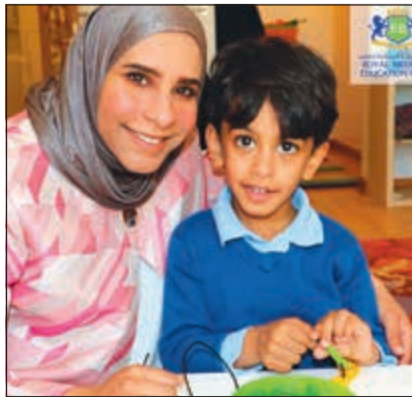
... ومشاركة بفرحة عيد الأم