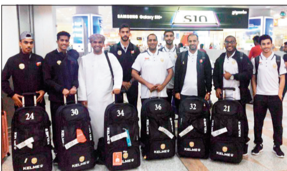
جانب من وصول الوفد العماني المشارك في البطولة

لاري أن المركز الإعلامي جاهز للافتتاح وهناك مباريات ستنتقل مباشرة وأخرى ستسجل وهناك استوديو خاص لنقل فعاليات الدورة وإجراء مقابلات مع الأصدقاء. وشكر لاري للجان العاملة ورجال الصحافة والإعلام على الجهود المبذولة لإنجاح التجمع الخليجي على أرض الكويت الطيبة أرض الصداقة والسلام.