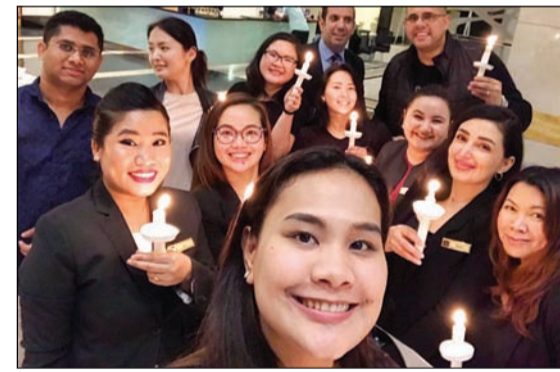
إضاءة الشموع في ساعة الأرض

شارك فندق ومركز مؤتمرات ميلينيوم الكويت ملايين الأفراد والمنظمات حول العالم في فعالية ساعة الأرض بهدف زيادة الوعي حول أهمية حماية البيئة واتخاذ المزيد من الإجراءات التي تخفف من وتيرة التغير المناخي. وقام الفندق بدعم المبادرة يوم السبت 30 مارس 2019 في تمام الساعة 8:30 مساءً بالتوقيت المحلي من خلال تنفيذ عدة إجراءات لتوفير