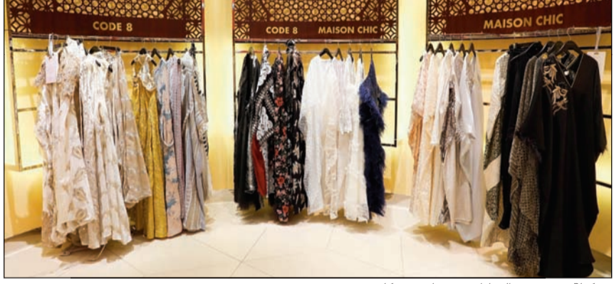
تشكيلة مميزة من القفاطين في هارفي نيكلز

واستعداداً لاستقبال الشهر الكريم، يقدم هارفي نيكلز تشكيلة متنوعة من تصاميم القفاطين الأنيقة التي تعد الخيار الأمثل للمناسبات والأجواء الرمضانية، خلال حفل أقيم بحضور نخبة من الشخصيات المؤثرة في مجال الأزياء، بالإضافة إلى العديد من شخصيات المجتمع والإعلاميين وزبائن العلامة التجارية ليكونوا بين أول من يتعرف على التشكيلة الحصرية لعام 2019.