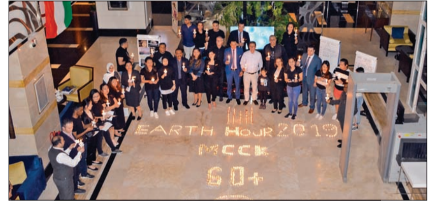
فريق «ميلينيوم الكويت» خلال مشاركته بساعة الأرض