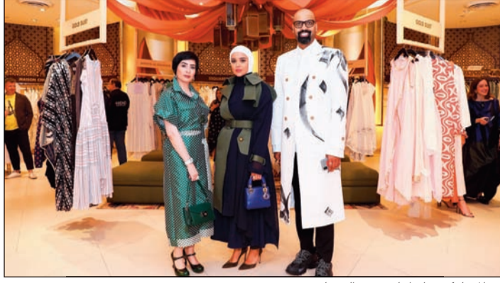
من المشاركين بإبداعاتهم من التصميم