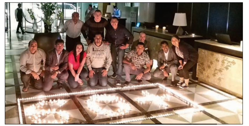
فريق حياة ريجنسي الكوت مول خلال ساعة الأرض