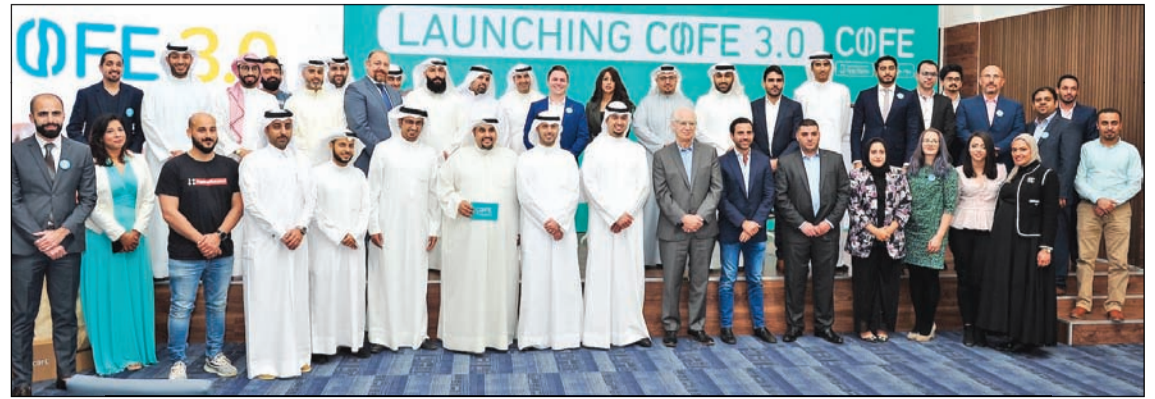
فريق كوفي مع المستثمرين من الخليج (ريليش كومار)

وقد عبر حامد البطلة مدير فندق ومنتجج كوبثورن الجهراء عن مسعاداته بالمشاركة في هذه الحركة العالمية، وقال: «نشعر بالفخر بالمشاركة في هذه الحركة العالمية للحفاظ