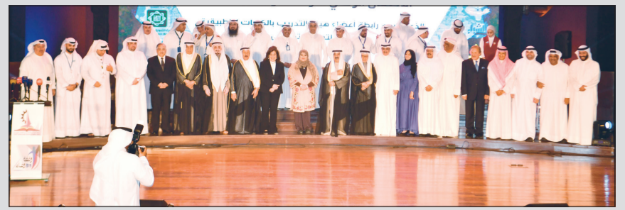
الشيخ ناصر صباح الاحمد متوسلا المكرمين من أبناء الكويت خلال احتفالية «وقفه وفاء 2019»

النائب الأول كرم مجموعة من أبناء الكويت المتميزين