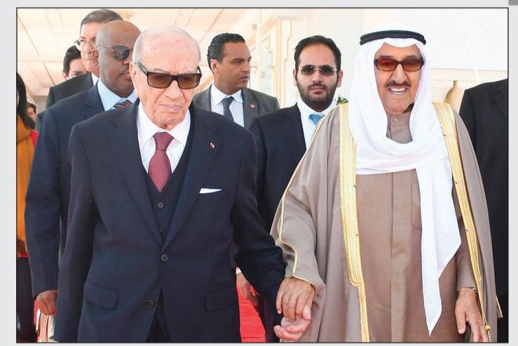
صاحب السمو الأمير الشيخ صباح الاحمد مع الرئيس التونسي الباجي السبيسي

أوضحت مصادر مطلعة في تصريحات خاصة لـ «الأنباء» أن ديوان الخدمة المدنية سيصدر قراراً بتجديد العمل بقرار وقف نقل وندب الموظفين بين الوزارات والهيئات والجهات الحكومية. وأكدت المصادر أن القرار المطبق منذ عام 2013 يحظى بتأييد واسع بين الجهات الحكومية التي طالبت باستمرار تطبيق العمل بقرار وقف النقل والندب، واستدركت قائلة إن القرار حقق العدالة والشفافية لجميع موظفي الدولة من دون تفضيل أو تمييز لأي موظف. وذكرت أن القرار سيعمم بعد