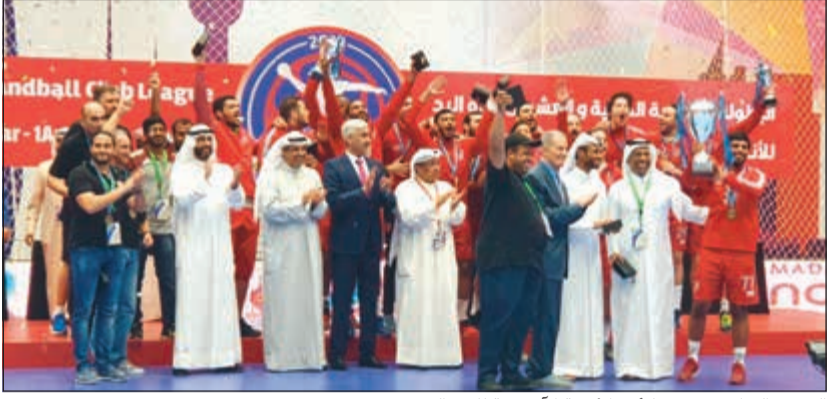
الدحيل القطري يتوج بكأس الأندية الآسيوية لكرة اليد