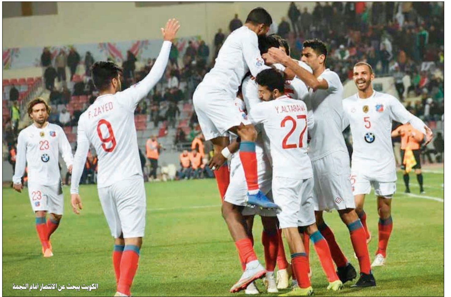
الكويت يبحث عن الانتصار أمام النجمة