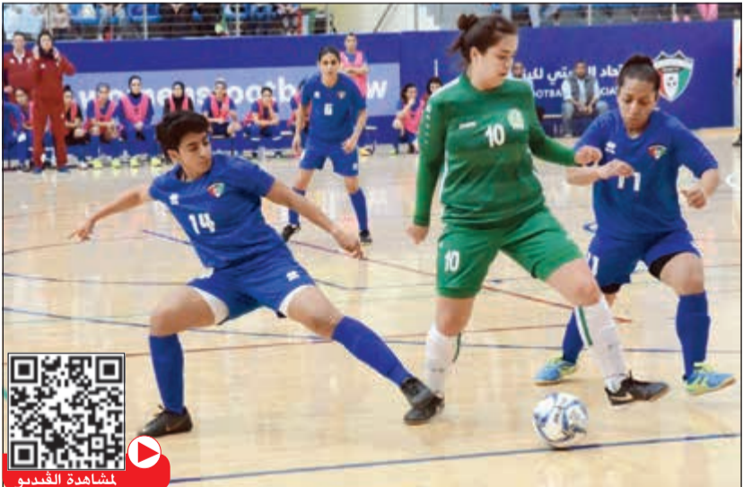
تجربة أولى مفيدة لأزرق سيدات كرة الصالات مع تركمانستان (محمد هندواي)