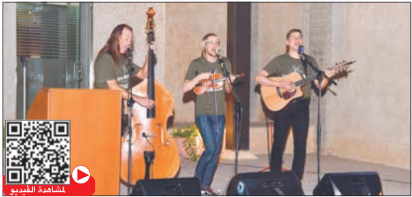
أعضاء فرقة كايل ديلينجهام الأميركية خلال الأمسية