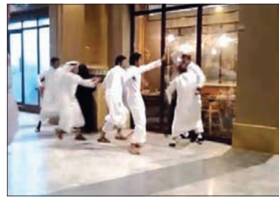
المتهمون يتهالون على أحد المجني عليهم ضرباً بالعقال