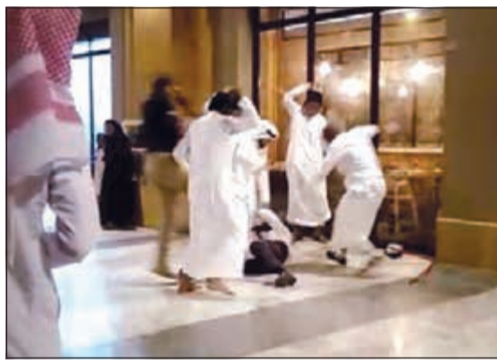
ويطرحون الواقد أرضاً ويواصلون الاعتداء عليه بالعقال